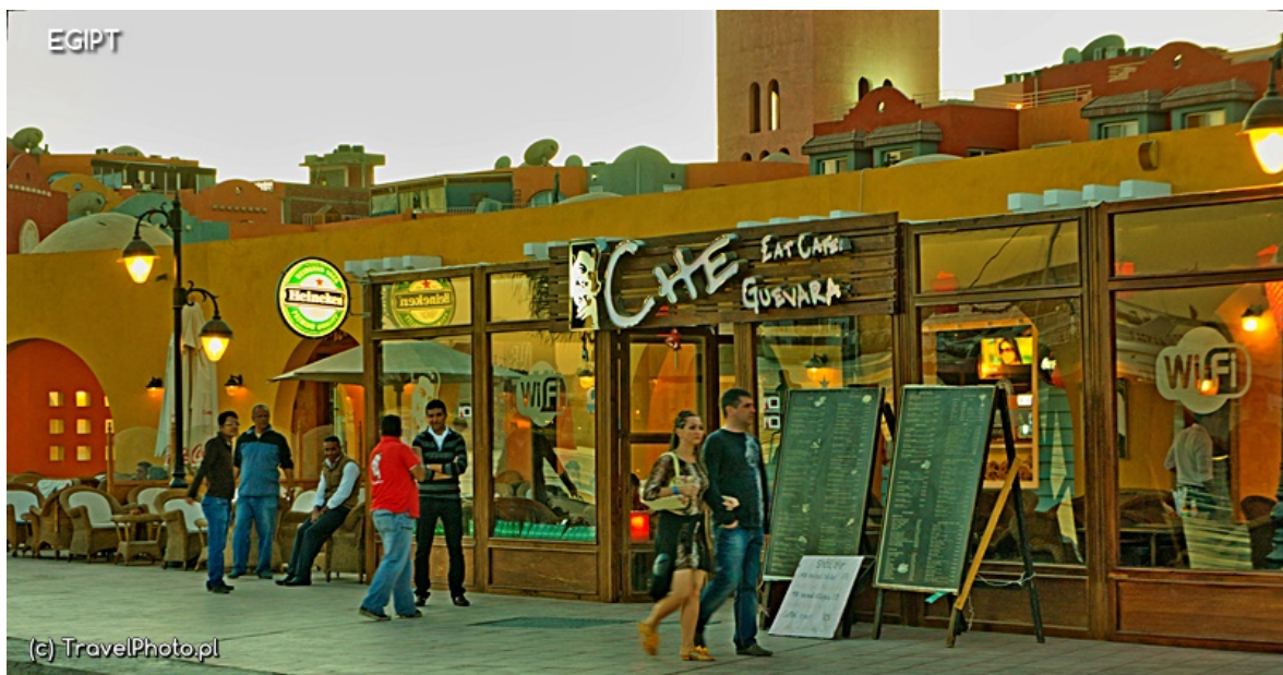
Sklepy w okolicy mariny

Nie skusisz się? Przecież to okazja, taka drewniana miseczka albo skórzana walizka, albo te malowane papirusy. Jak się skusisz, a nie potargujesz, to być może odkryjesz potem w sklepie ze stałymi cenami, że trzykrotnie przepłaciłeś tę „okazję”. Ale nie ma co się obrażać, ceny, nawet te dla turystów, i tak do pięt nie dorastają cenom w Europie Zachodniej, bo gdzie tam byś kupił długie laski cynamonu za 10 albo inkrustowane pudełko na biżuterię za 20 zł?