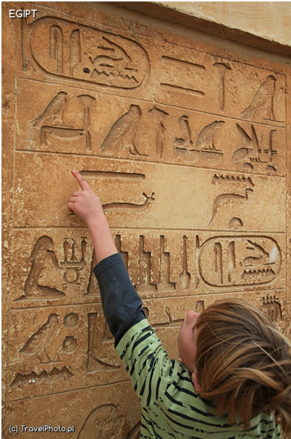
Sakkara - hieroglify