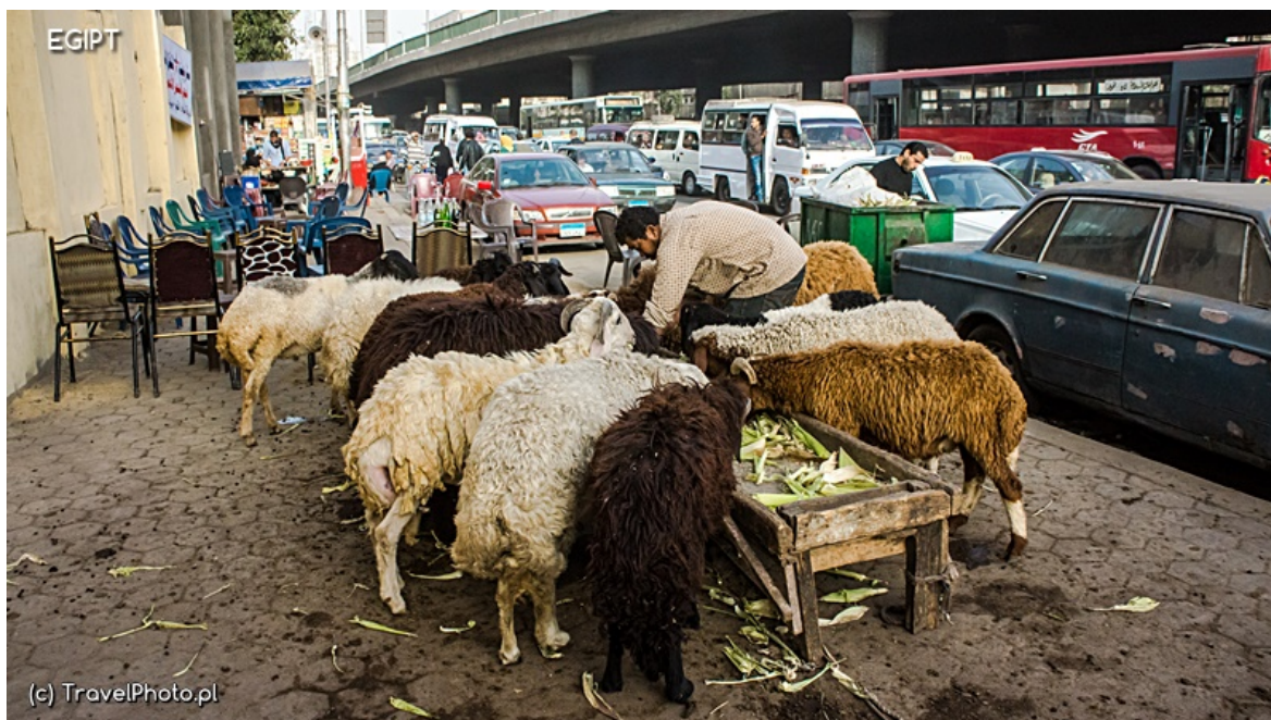
Kair - scenki uliczne

Co chwila wiatr podrywa w opętańczym tańcu tumany piasku, trzeba szybko zamknąć oczy, przeczekać, po chwili można ruszać dalej. I pomimo tego wszechobecnego kurzu, walających się wszędzie śmieci, wszechobecnego cmentarzyska rzeczy niepotrzebnych zawsze zobaczysz kogoś podejmującego się syzyfowej pracy przecierania szyb w aucie, omiatania towaru na straganie, zamiatania chodnika przed sklepem. Tytaniczna praca bez końca, by choć skrawek tego świata był piękniejszy.