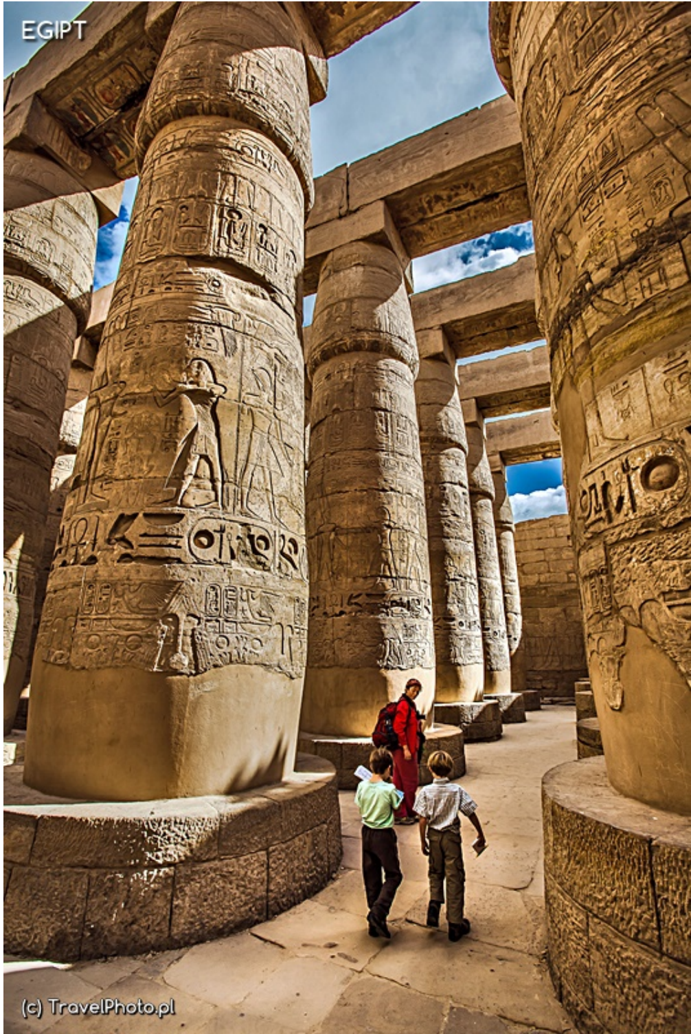
To malutki fragment Karnak Temple