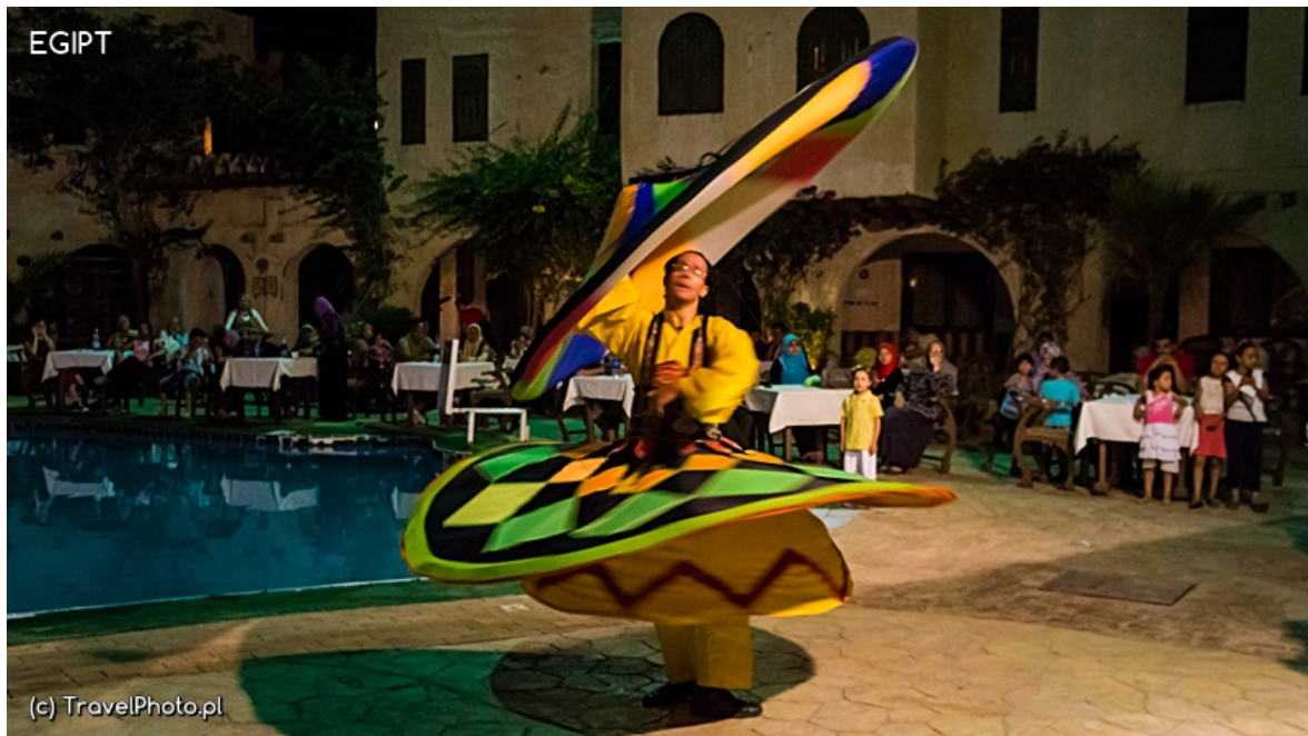
Szarm el-Szejk - wirujący derwisz

scenę i z kolejnej spódnicy czyni otaczający go stożek! Wreszcie po półgodzinie kończy pokaz, po czym, nie dbając o oklaski, znika w zakamarkach hotelu.