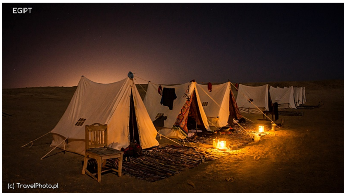
Nasza baza nurkowa w Ras Muhammad NP - namioty w których śpimy

Też pytanie! Wprawdzie bardzo miło mieszka się nam w Szarmie, ale odwiedziny w Parku Narodowym Ras Muhammad to wspaniały pomysł. Wraz z rozwojem turystyki Egipcjanie szybko zorientowali się, że martwą rybę można sprzedać tylko raz, za to żywe przyciągają turystów przez lata, dlatego w 1983 roku na terenach południowego przylądka Synaj utworzono pierwszy w Egipcie narodowy park morski: Ras Muhammad. Tutejsze rafy uważane są za jedne z piękniejszych w świecie. Zwykle nurkowie docierają tu na łodziach, tym razem mamy szansę poznać to miejsce od strony lądu.