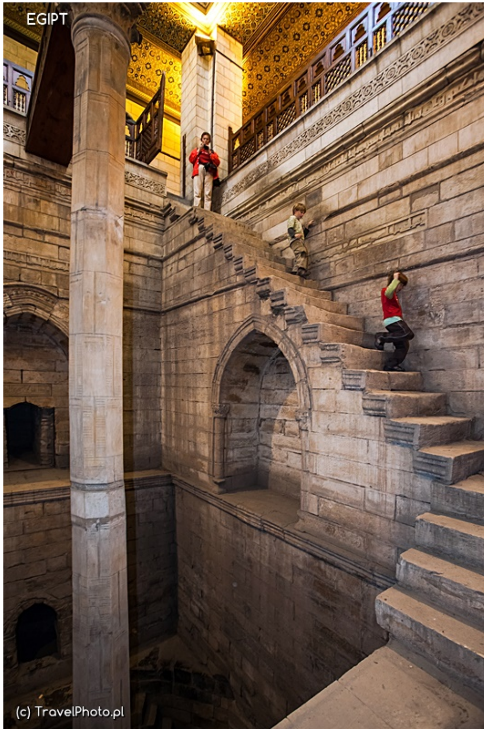
Nilometr - schodzimy na dół