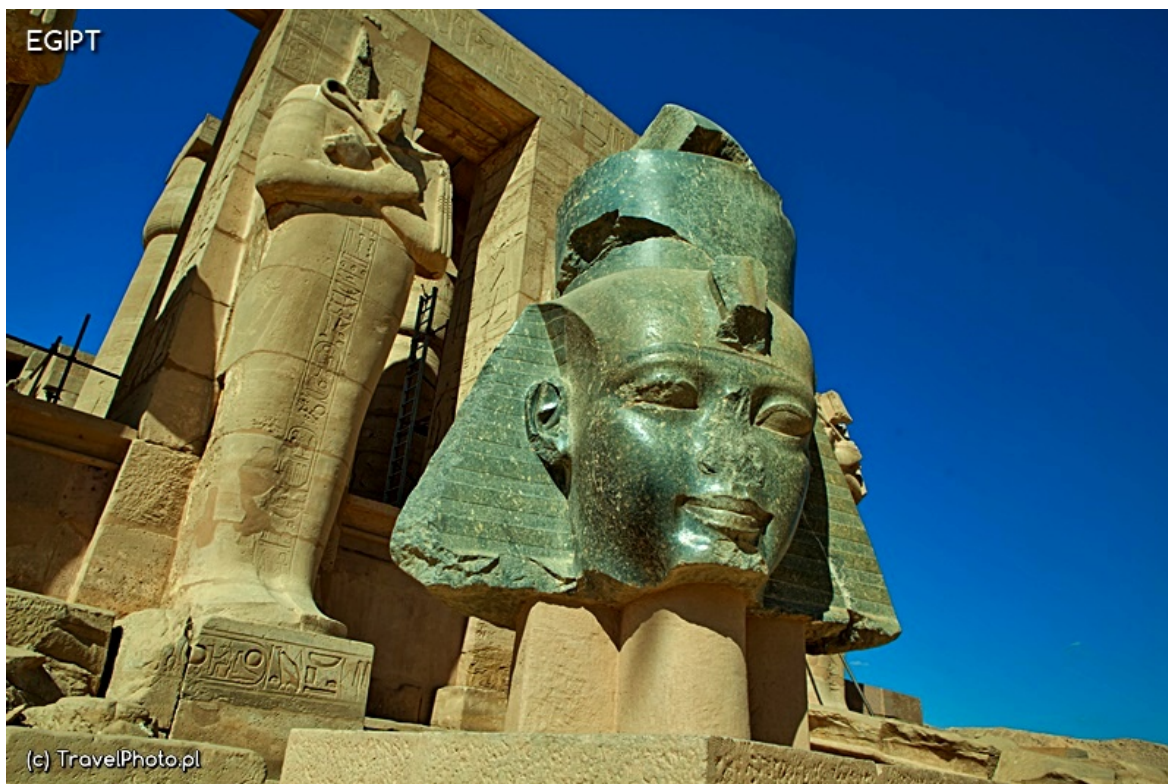
Zachodni Brzeg - Ramasseum