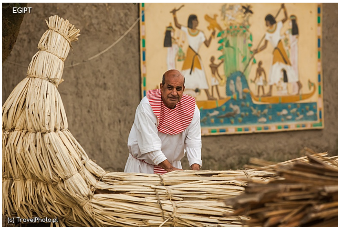
Wytwarzanie łodzi z papierusa