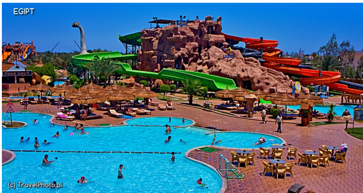
Szarm el-Szejk - aquapark

targu zajmują pamiątki i stylowe restauracje. Kto szuka uciech, udaje się do Naama Bay – stylowej dzielnicy droższych hoteli, modnych dyskotek i nocnych klubów, a na miłośników wodnej adrenaliny czeka aquapark z płataniną niebotycznie wysokich zjeżdżalni.