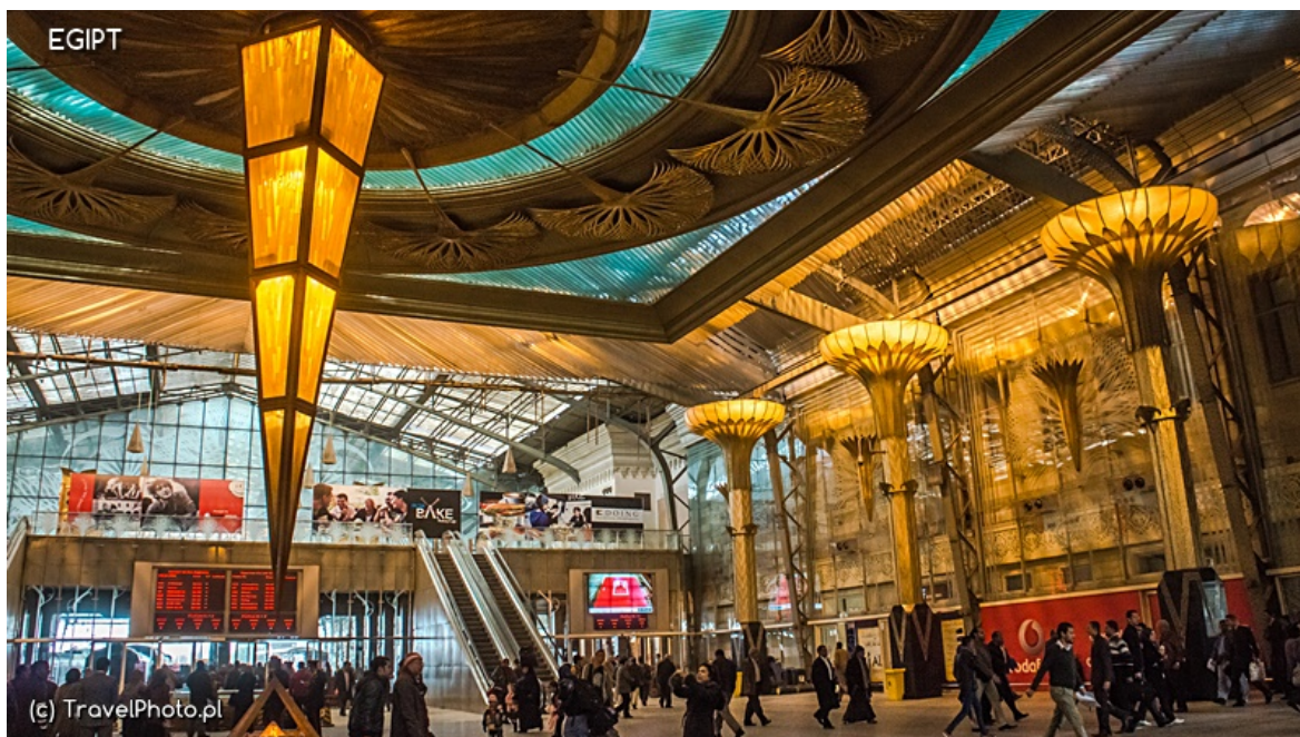
Dworzec kolejowy Ramzes