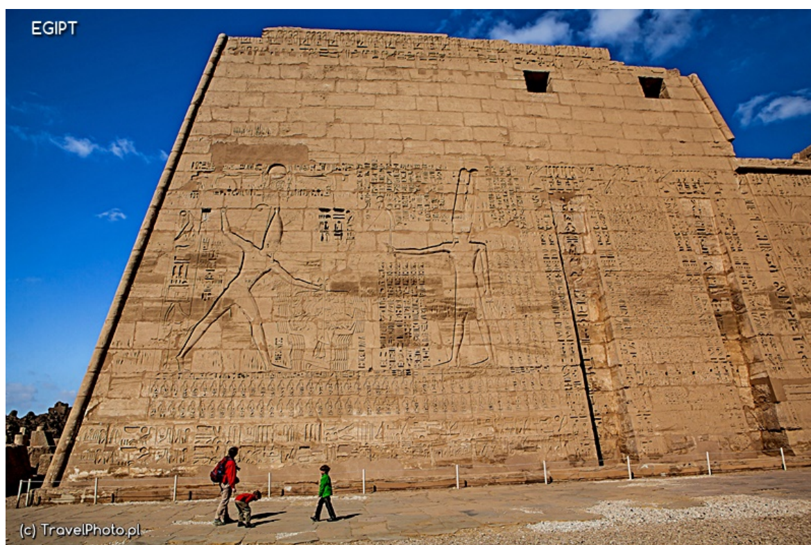
Zachodni Brzeg - Medinet Habu Temple

Wreszcie moje studia romanistyczne na coś się przydały! Widok jego zdumionych oczu – bezcenny! No i rzecz jasna, począpał dalej, depcząc Szacowny Zabytek, bo prawdę mówiąc, nie da się w Egipcie chodzić inaczej, niż stąpając po Historii.