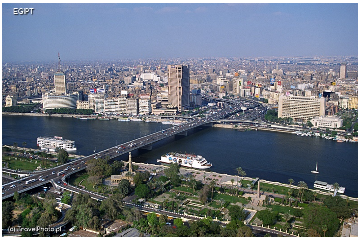
Panorama Kairu z naszego hotelu