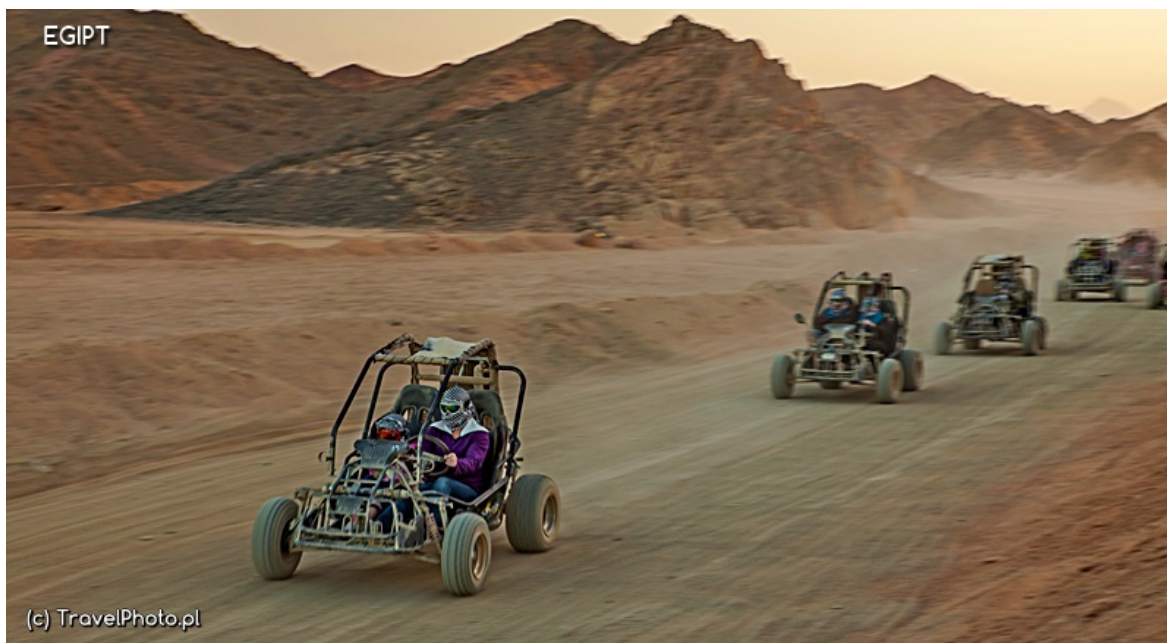
Tym razem jazda piaskowymi buggy

– Yalla, yalla! Szybciej! – poganiają stalowe rumaki.