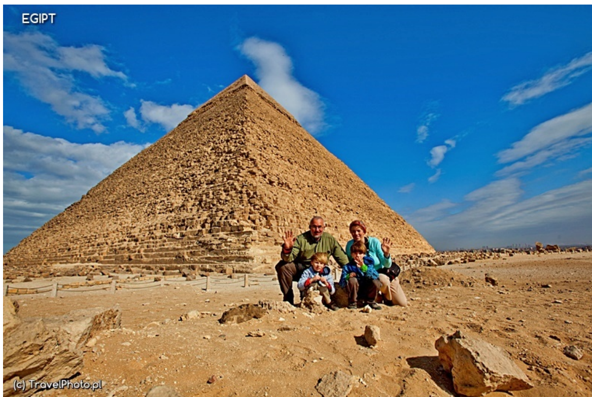
Na tle piramidy Cheopsa