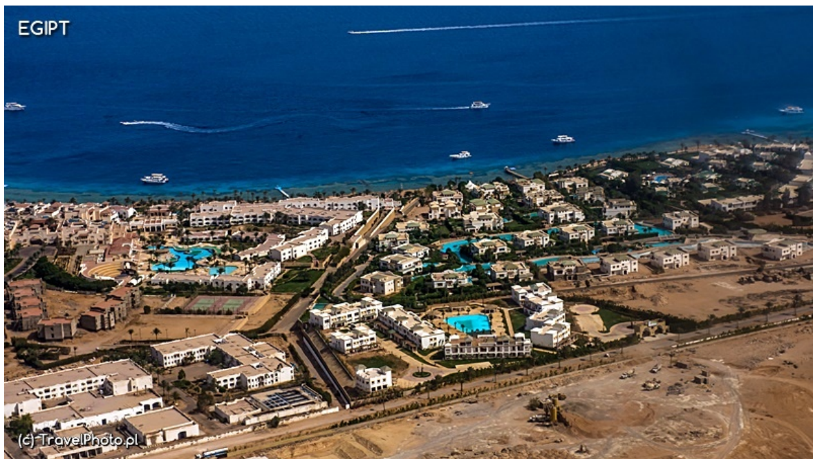
Szarm el-Szejk - widok z samolotu

Miasto powstałe na pustyni, stworzone ku rozrywce i wypoczynkowi. Gdy po raz pierwszy tu trafiłam, nie mogłam wyjść ze zdumienia. Wielogwiazdkowy hotel sąsiadował z kolejnym i kolejnym... Ale gdzie jest miasto? Starówka, targ, jakieś zabytki? Patrzono na mnie, nie rozumiejąc pytania. Zabytki? Chyba chodzi ci o zbytki? Bo sensem istnienia tego miejsca są turyści, dla nich wszystko!