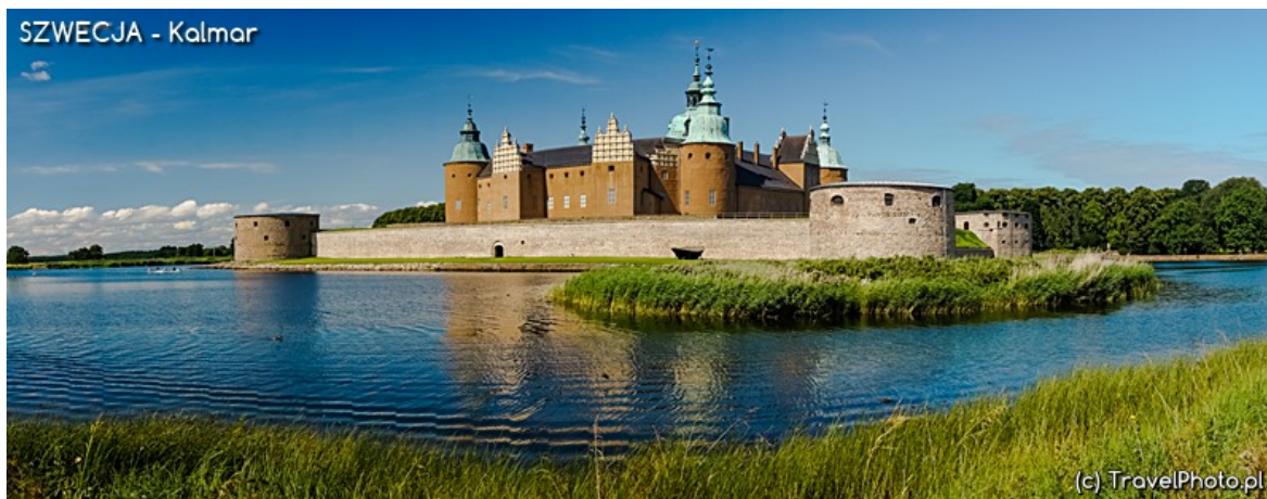
Kalmar - zamek

Dokładnie taki, jaki powinien być. Porządna królewska siedziba otoczona fosą, z grubymi warownymi murami, strzelistymi wieżami i małutkimi okienkami. Idealnymi, by machać z nich chusteczką w oczekiwaniu na księcia. Zamiast jednak siedzieć na wieży, królowa przemyka koło mnie, goniona przez dwóch rycerzy. Spod stylowej sukienki migają czerwone trampki. Bo królowa jest jak najbardziej współczesna, ale podobnie jak mali rycerze woli zwiedzać zamek w historycznych strojach, tak jest przecież znacznie ciekawiej! Na dziedzińcu co chwila słyhać szczęk mieczy.