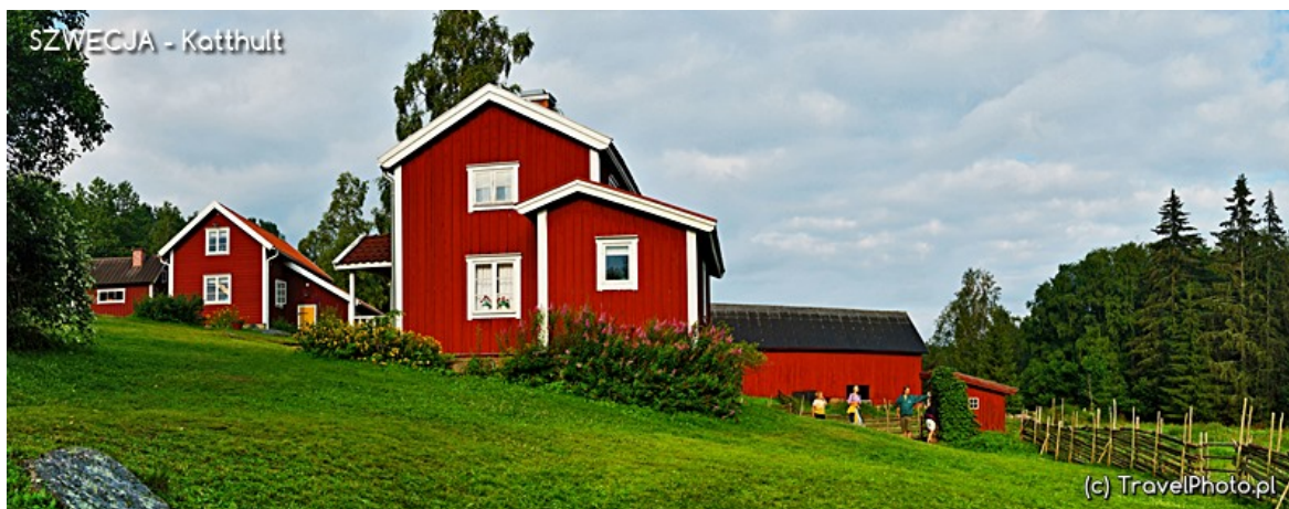
Zagroda w Katthult, która grała w filmie.