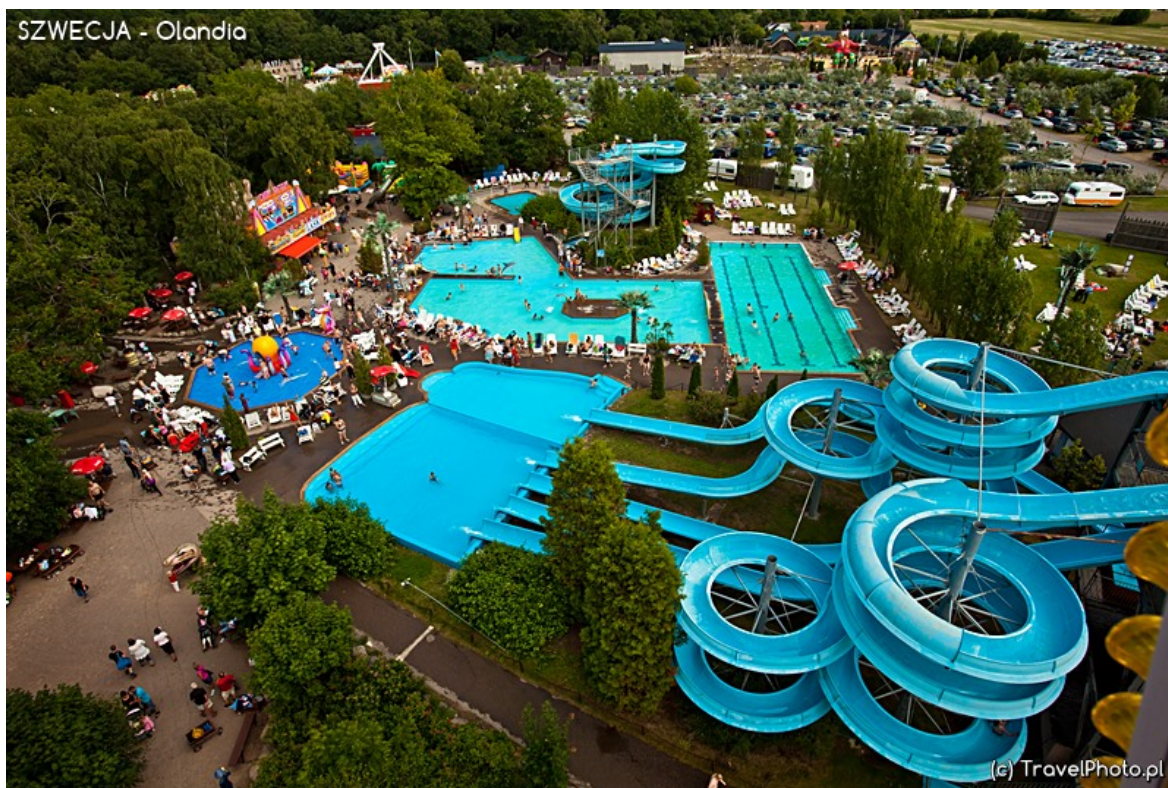
Olands Djur and Nojespark

Ostatecznie dobrze byłoby, aby wyprawy z rodzicami nie kojarzyły im się jedynie jako jazda obowiązkowa od zabytku do zabytku. A zatem jedziemy do Olands Djur and Nojespark, jednego z największych szwedzkich parków rozrywki. Przy wejściu wita nas gigantyczny posąg klauna, wznoszący się na kilka pięter nad kasami. Mógłby śmiało statystować w horrorze. Już widzę oczyma duszy, jak z demonicznym uśmiechem idzie miastem, rozdeptując auta. Ponosi mnie wyobraźnia. To tylko przedsmak tego, co czeka nas wewnątrz. Nawet reklamy tutejszych fast foodów dopasowały się do festynowej stylistyki: metrowy hot dog z radosnym uśmiechem wylewa na siebie keczup, gigantyczny rożek z frytkami, mrugając okiem, zjada frytkę, a z megaburgerów wielkości pięciolatka wypływa musztarda. Żegnaj, zdrowa i proekologiczna Szwecjo, witaj, ludyczna rozrywko ze strzelnicami i watą cukrową!