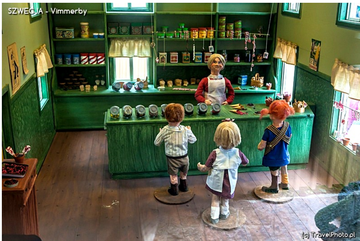
Pippi kupuje 18 kg cukierków.