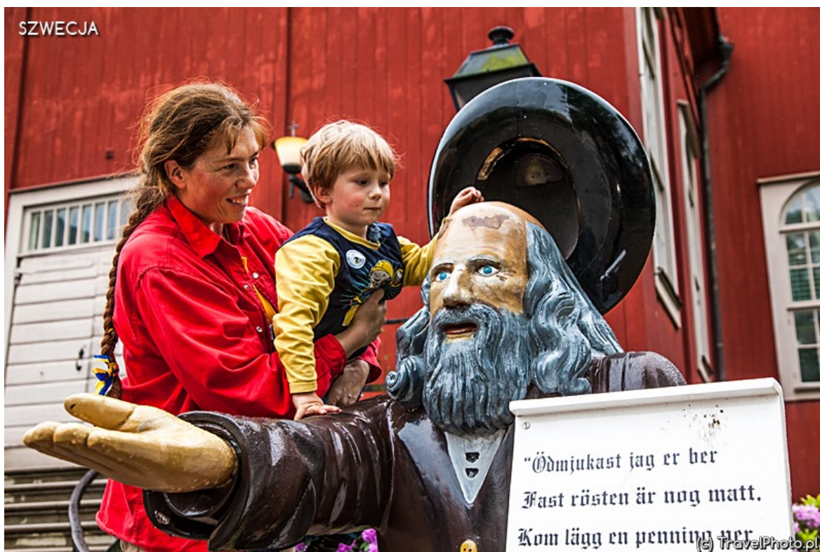
Rosenbom - skarbonka.

Podnosimy zatem i my, a chłopcy bardzo zaaferowani wrzucają kolejne monety. Wrzuciliby pewnie wszystkie nasze oszczędności, gdybyśmy im na to pozwolili. To właśnie pod tym kapeluszem schował się mały Nils przed goniącym go spizowym królem Karolem, gdzieś tutaj musi być zatem jego postać.