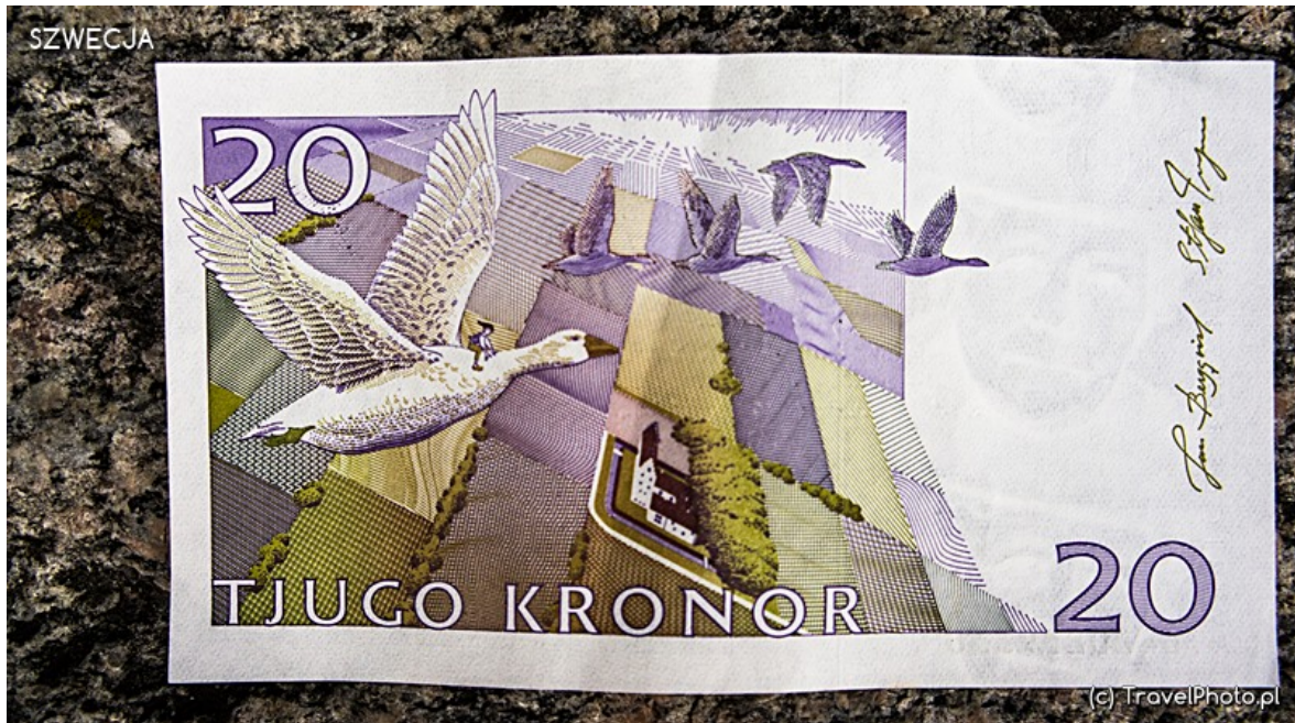
20 korton z Nilsem.

w karzełka przemierzał z dzikimi gęśmi cały kraj. Postanawiamy ruszyć jego śladami.