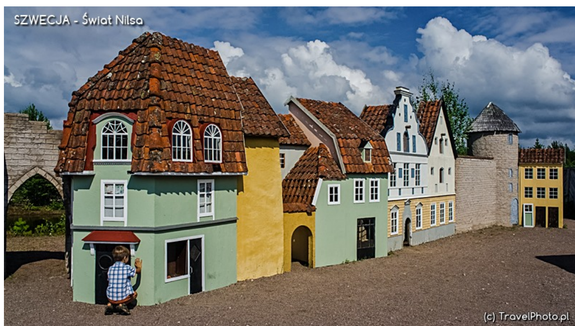
Rynek miasteczka w miniaturze.

- Myszki kochane, proszę was, muszę zrobić tu zdjęcie, czy moglibyście mi pomóc?