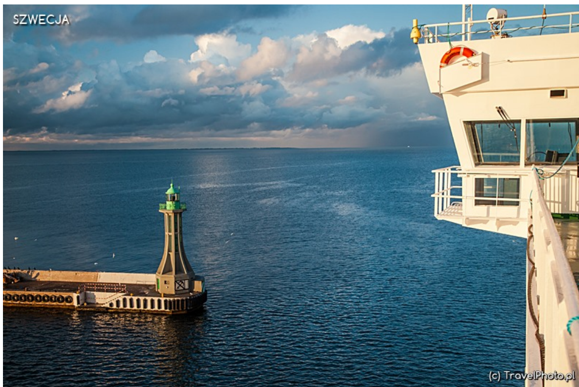
Główki portu. Przed nami otwarte morze!

Nie będę dorabiała ideologii, że w życiu nie cel ważny, lecz droga, ale coś z tych opowieści we mnie pozostało.