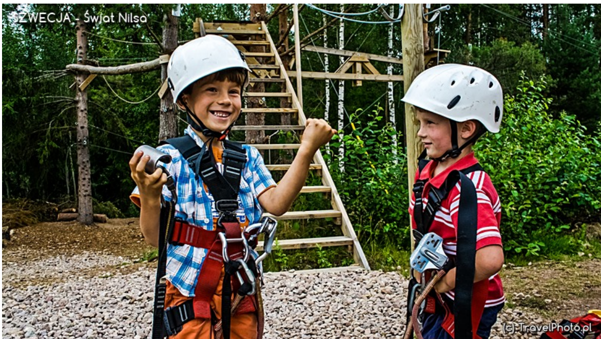
W parku linowym.

Słońce powoli się obniża, a przecież w pobliżu czeka na nas jeszcze jedna atrakcja: zagroda Emila ze Smalandii (w oryginale: Emila z Lonnebergi) w Katthult.