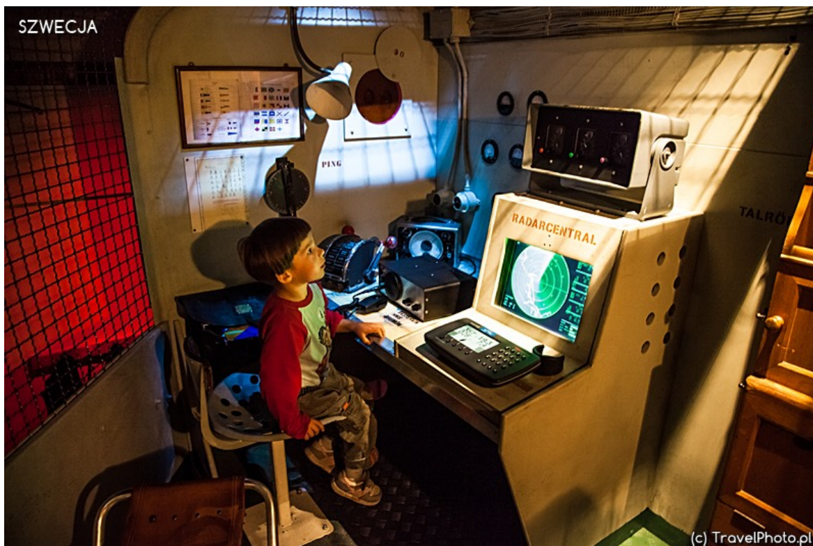
Michał jako radzik i nawigator.