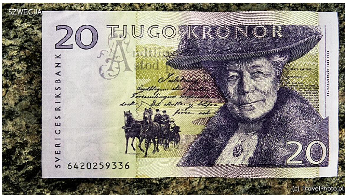
Selma Lagerlof jest na banknocie 20 koron.

Chciała, by szwedzkie dzieci poznały i pokochały swój kraj. Długo głowiła się, jak tego dokonać, bo też każdy z kolejnych pomysłów na książkę nie był jej zdaniem dość dobry. Aż pewnego dnia doznała olśnienia. Pokaże dzieciom Szwecję poprzez podróż! Wymyśliła niezwykłą historię Nilsa Holgerssona, nieznośnego urwisa, zmienionego przez krasnoludka w tyliciego człowieczka, który wraz z dzikimi gęśmi przemierza cały kraj od Skanii do Laponii, poznając przy okazji jego historię, baśnie i tradycje. Jest to także opowieść o dorastaniu, przyjaźni, odwadze, miłości i tęsknocie.