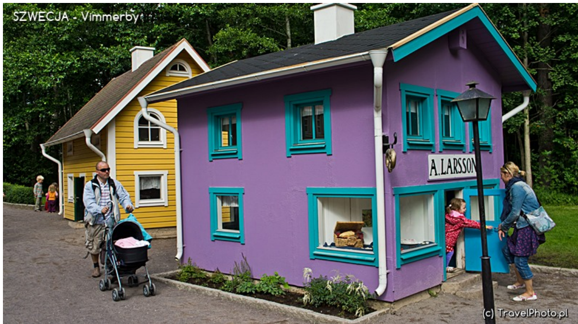
Ulica Lotty w Astrid Lindgren World.

nie chce się ubrać, co zrobiłaby polska mama? Dała jej klapsa, nakrzyczała i posłała za karę do pokoju bez śniadania. Lub coś w tym stylu. Co robi mama Lotty? Pozwala się jej... wyprowadzić z domu!