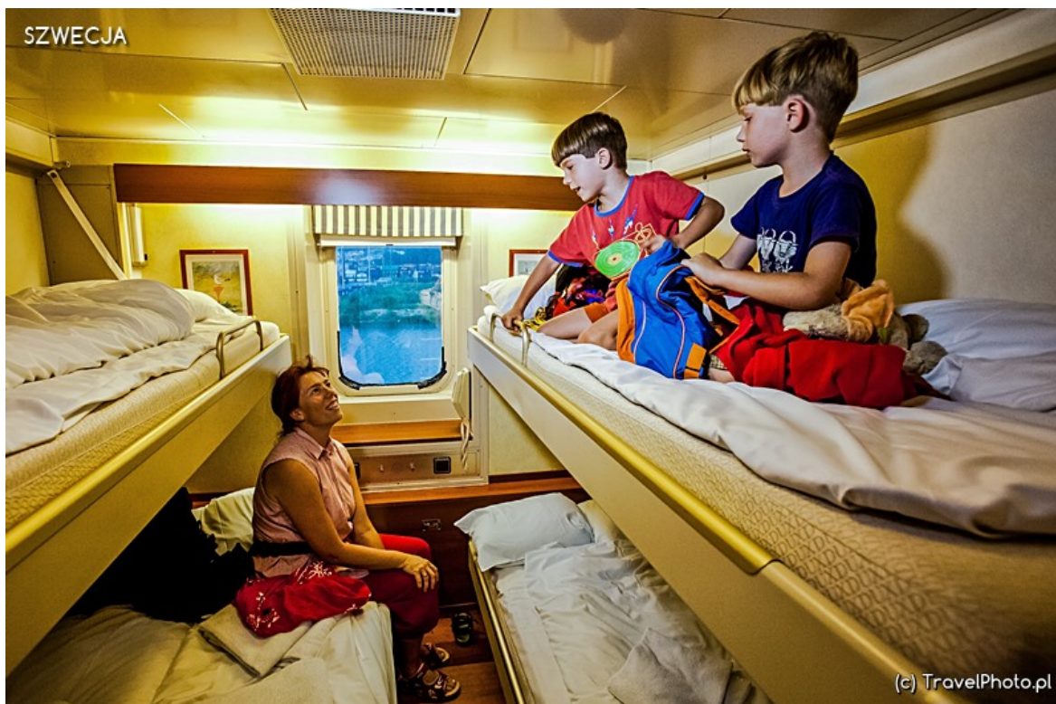
Na koi w kajucie...