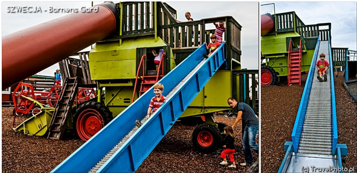
Zjeżdżalnia ze starego kombajnu.