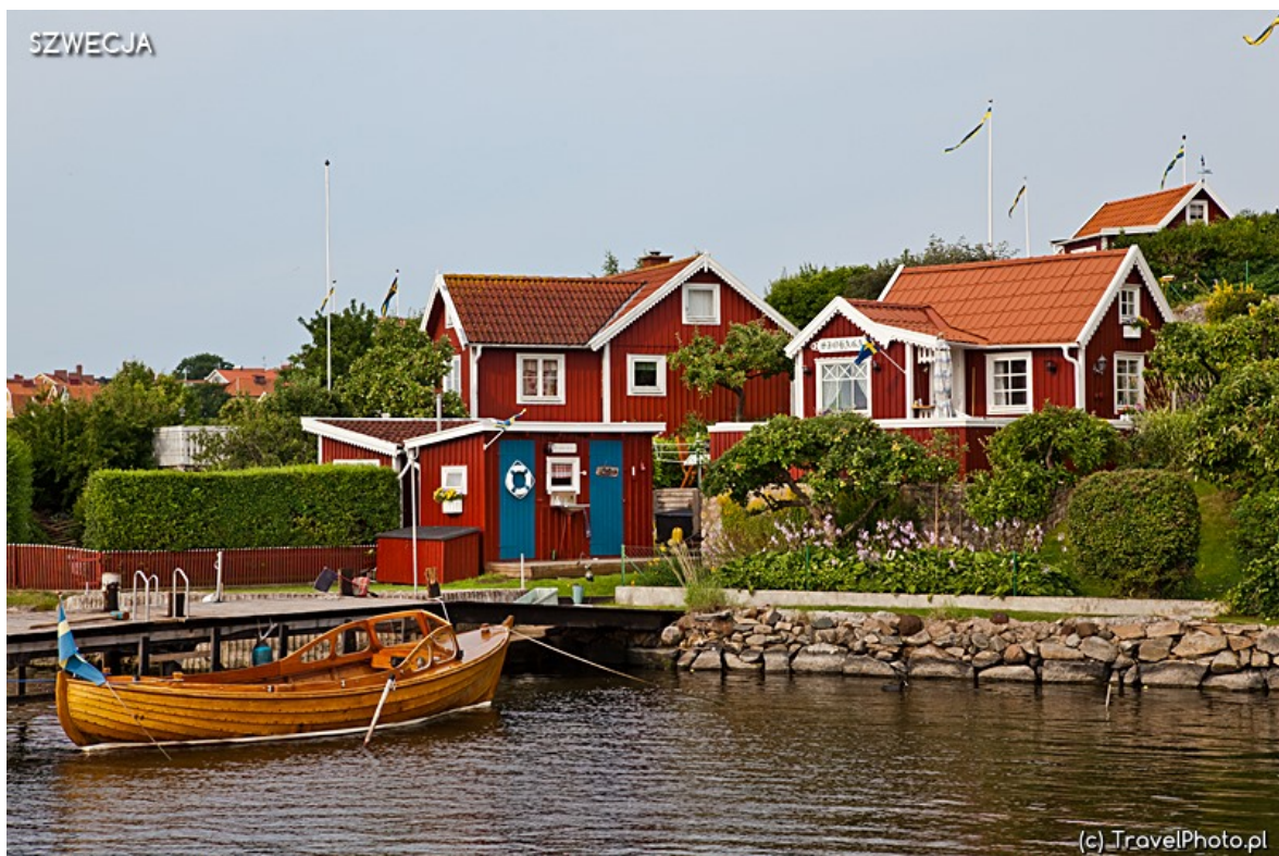
Typowa szwedzka architektura.

zmieszany z mąką i olejem lnianym świetnie konserwował drewniane domy. Dziś używa się nowej technologii, ale charakterystyczny kolor falurowy pozostał ten sam. Przed domkami powiewają niebiesko-żółte flagi, w oknach widać miniaturowe latarnie morskie, żaglowce i mewy. To idealne miejsce do zrozumienia szwedzkiego podejścia do życia. Praktycznego, ekologicznego i ceniącego piękno w prostocie oraz tradycyjne wartości. Ciekawe, co o Polakach powiedziałyby nasze ogródki działkowe?