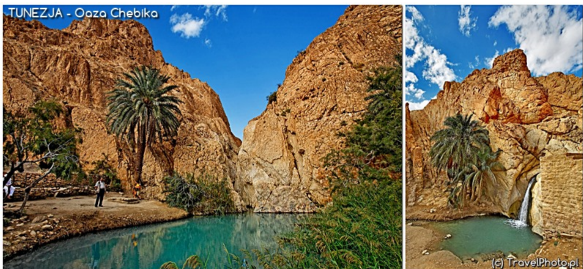
Oaza Chebika z... wodospadem!

Po ciszy pustyni ich śpiew brzmi niczym najpiękniejsza muzyka. Potem żaby. Może to mało romantyczne, ale też jednocześnie zupełnie niespodziewane. Po horyzont kamienna nicość i nagle: żaby . I jeszcze szum wody. Oaza to obietnica szczęścia. Spełniona nadzieja. Choć raz w życiu warto wyruszyć na pustynię, by docenić dar wody i marność naszych ziemskich pragnień. Absurdalnego gromadzenia rzeczy, które w ostateczności nas nie uratują. Tu liczy się tylko sprawne auto, zapas wody i dobra mapa.