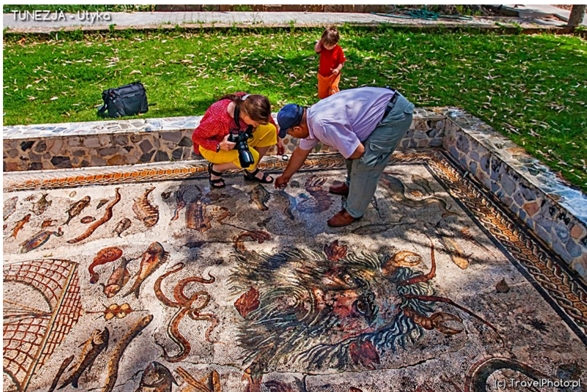
Szczegółowe analizowanie antycznych mozaik.

- Ależ chodź tu bliżej, zobacz, jaka ciekawa ryba!