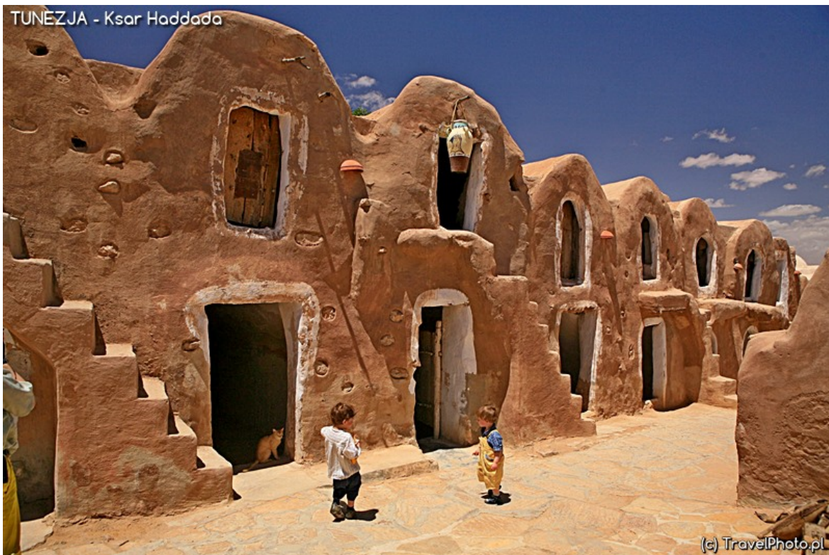
Ksar Haddada ma wiele uliczek i zaułków.