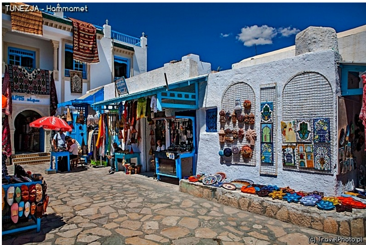
Sklepy dla turystów w Hammamet.

I tak na dostępie (lub raczej jego braku!) do wysokoprocentowych trunków skończył się sen o turystycznej potędze Libii. Człowiek to