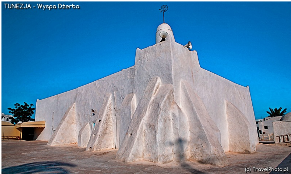
Meczet Umm al-Turkijja.

pierwsze rzuca się w oczy, jest biel. Białe ściany domów, hoteli i funduków - dawnych zajazdów, gdzie na górze były pokoje dla podróżnych, na dole zaś miejsce dla ich wielbłądów. Białe kopuły meczetów, których jest tu blisko 250, a wśród nich najbardziej oryginalną architekturę ma szesnastowieczny Umm al-Turkijja w Al-Ma'i. Właściwie patrząc na jego mury, trudno się domyślić, że to dom modlitwy, bo bardziej przypomina obronną twierdzę. Skojarzenie jak najbardziej uzasadnione, przecież nie zawsze na wyspie królował all inclusive. Swego czasu rządili tu złowrodzy bracia Barbarossa ( Rudobrodzi ), a także turecki korsarz Turgut, który po rzezi chrześcijan nakazał wznieść piramidę z ich czaszek. Tolerancja religijna nie była wtedy w modzie, choć to właśnie tutaj zamieszkuje jedna z najstarszych społeczności żydowskich.