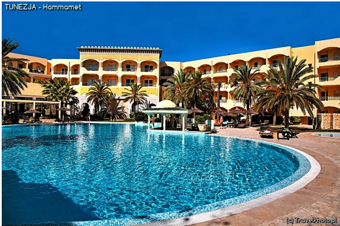
Jeden z hoteli w Hammamet.

pamiątkami. Im więcej gwiazdek, tym doskonalsza izolacja od życia miejscowych ludzi.