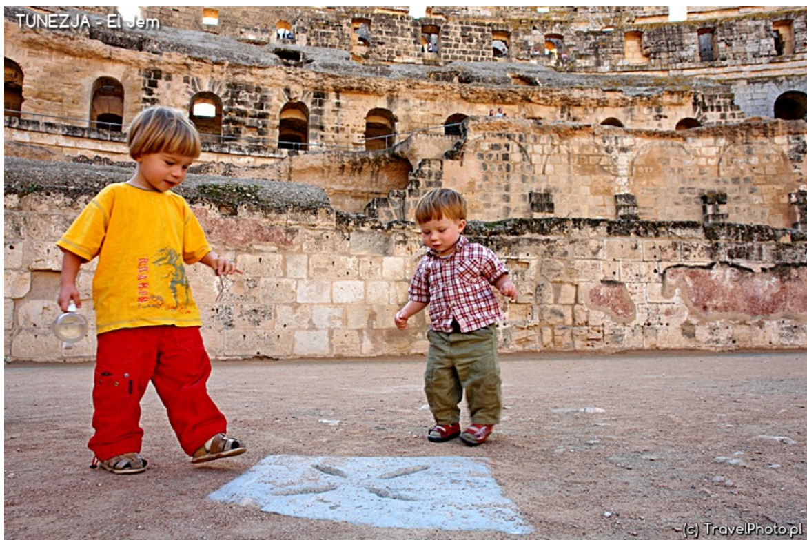
Nasi "gladiatorzy" w El Jem.

By dotrzeć do najdalej na zachód wysuniętej rzymskiej placówki w Dougga ( Zukka ; hist. Thugga ), musimy jechać kilka godzin samochodem.