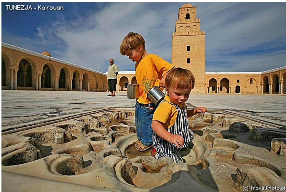
Kairuan - Wielki Meczet. Chłopcy bawią się nad cysterną, na środku dziedzińca.