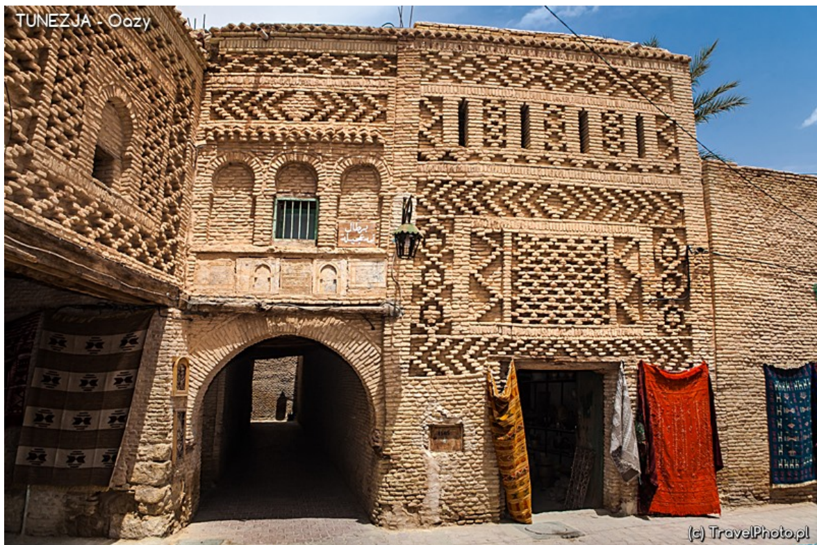
Tozeur - oaza jak miasto, czy miasto oaza...

Wabi tajemnicą i egzotyką, przywołując obrazy beduińskich namiotów rozpiętych pod gwiaździstym niebem, kilku palm daktylowych wokół studni i bezkres piaszczystych wydm dookoła. Rzeczywistość bywa znacznie bardziej prozaiczna, bo współczesne oazy w istocie niewiele różnią się od miast. Asfaltowe drogi wiodą między gajami palmowymi, murowanymi domami i nowoczesnymi hotelami. Gdy wjeżdżamy do Tazaru (fr. Tozeur ), w pierwszej chwili czujemy rozczarowanie. Jest za wielkie, przecież nic tu romantycznego nie pozostało!