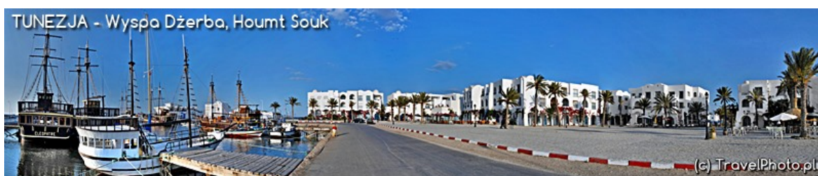
Panorama nadbrzeża w porcie.

Tak można by określić Odyseusza, który na skutek klątwy Posejdona przez dziesięć lat wracał do domu. Po drodze odwiedzał nieznanne lądy i mityczne krainy, co zostało skrupulatnie opisane przez Homera w Odysei. To jedno z tych dzieł, które do dziś inspiruje artystów, historyków i podróżników. Jednym z pierwszych miejsc, do których dotarł Odyseusz, była wyspa Lotofagów - zjadaczy lotosu. Słodczy zatrutego kwiatu sprawiała, że kto go raz skosztował, zapominał o ojczyźnie, pozostając na zawsze w mocy czarownicy wyspy. I tu rozchodzą się drogi mitu i historii, o ile bowiem faktycznie wyspa Dżerba (fr. Île de Djerba ) utożsamiana jest z wyspą Lotofagów, o tyle jednak nikt nie zjadał tu kwiatów. Ów miódny owoc, po którym ludzie żyli jak w letargu, spokojnie i bezpiecznie, to zapewne nic innego jak... daktyl, a te faktycznie są tu przepyszne i pozwalają zapomnieć o całym świecie (a już pewnością trzeba zapomnieć o diecie!).