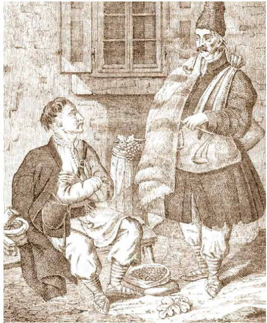
Bojkowie na rycinach z pierwszej połowy XIX wieku (domena publiczna)