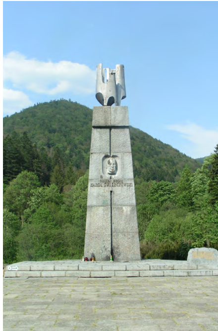
Nieistniejący obecnie pomnik w miejscu śmierci Karola Świerczewskiego (domena publiczna)