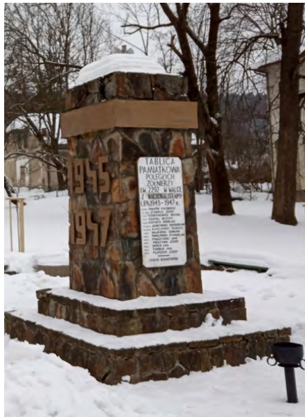
Tablica pamiątkowa żołnierzy poległych w walkach z UPA w Ustrzykach Dolnych