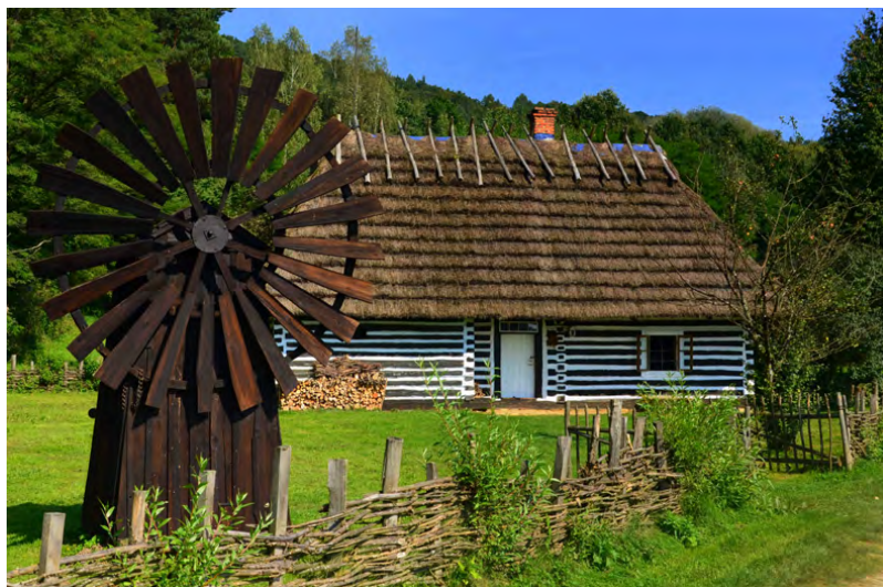
Charakterystyczna dla ziemi sanockiej zagroda prezentowana w skansenie

W 1339 roku książę halicko-włodzimierski Bolesław Jerzy II nadał Sanokowi prawo miejskie na regule magdeburgskiej. Miasto od dnia lokacji było zamieszkiwane przez wiele narodowości i dynamicznie rozwijało się, korzystając ze swojego położenia na pograniczu polsko-węgierskim, na szlaku handlowym na Ruś. Zabytkiem pamiętającym średniowieczną i nowożytną historię grodu nad Sanem jest zamek królewski, z którego roztacza się piękny widok na rzekę.