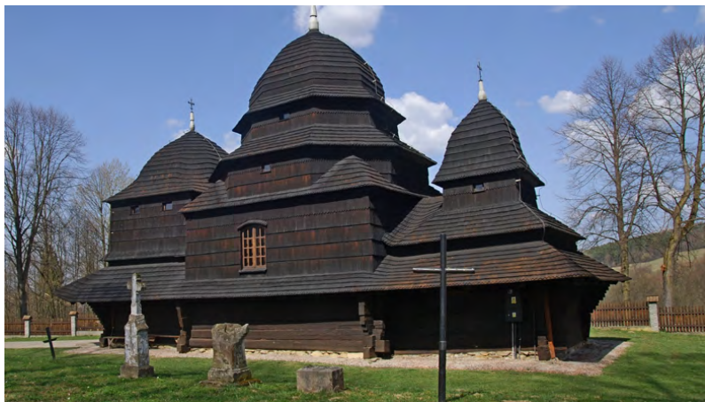
Cerkiew w Równi

Wielu turystów rozpoczyna swoją przygodę z Bieszczadami właśnie w Komańczy, przez którą prowadzi Główny Szlak Beskidzki. W przełomowym dla naszego kraju listopadzie 1918 roku kilkadziesiąt okolicznych wsi utworzyło tak zwaną Republikę Komańczańską. Przywódcami ruchu byli duchowni grekokatolicki, którzy chcieli przyłączyć te ziemie do Zachodnioukraińskiej Republiki Ludowej. Na zasadzie pospolitego ruszenia utworzono milicję. Na Żydów został nałożony dodatkowy podatek na rzecz jej utrzymania.