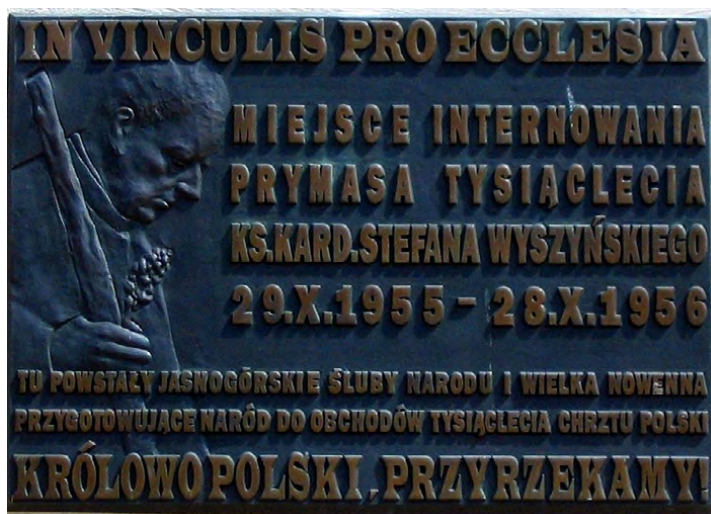
Pamiątkowa tablica na klasztorze nazaretanek w Komańczy, fot. Goku 122 (CC BY-SA 4.0)

Siły polskie wkroczyły do Komańczy dwa miesiące później. Konflikt był zapowiedzią późniejszych krwawych starć w tym regionie.