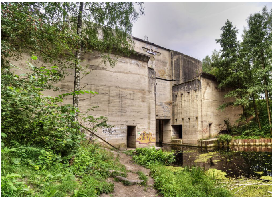
Nieukończona śluza Kanału Mazurskiego w Leśniewie Górnym. Uwagę zwraca hitlerowska „gapa” na szczycie budowli.

koryto kanału, podjęto też prace budowlane nad śluzami i innymi urządzeniami technicznymi. Po drugiej wojnie światowej projektu nie kontynuowano, m.in. z powodu przecięcia kanału granicą polsko-radziecką. Obecnie po stronie polskiej znajduje się odcinek o długości około dwudziestu kilometrów i pięć śluz: w Leśniewie Górnym, Leśniewie Dolnym, Gui, Bajorach i Adolfowie, z czego tylko śluza Piaski w Gui została całkowicie ukończona.