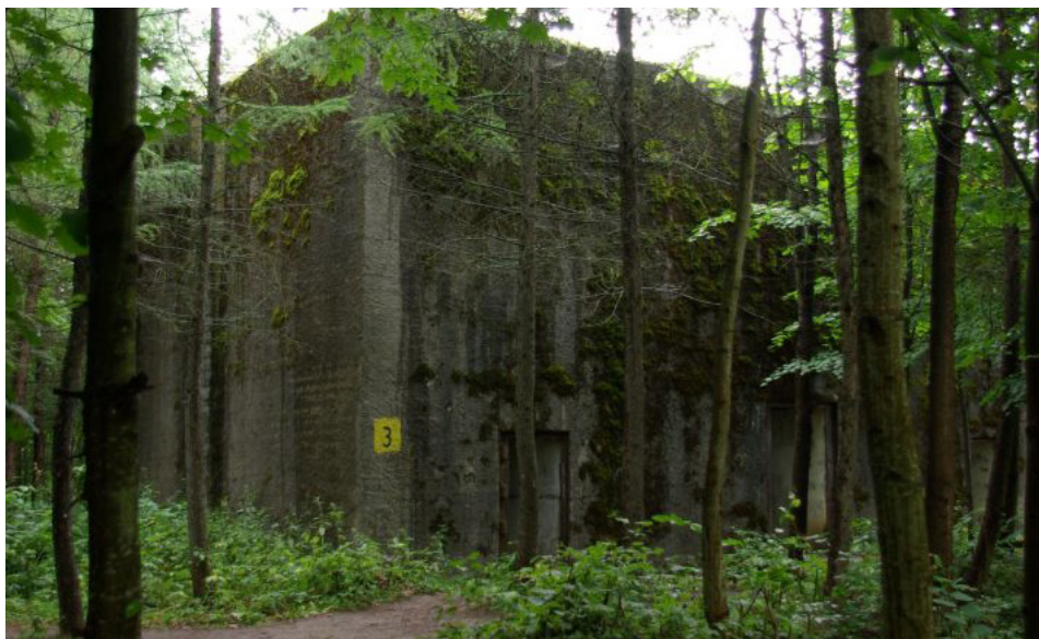
Jeden ze schronów betonowych na terenie Kwatery OKH w Mamerkach.

Utworzenie Wilczego Szańca skutkowało powstaniem innych kwater głównych instytucji wojskowych III Rzeszy oraz wielu dygnitarzy nazistowskich. Najciekawszą z zachowanych jest Kwatera Naczelnego Dowództwa Wojsk Lądowych (OKH) w Mamerkach, położona niedaleko Węgorzewa