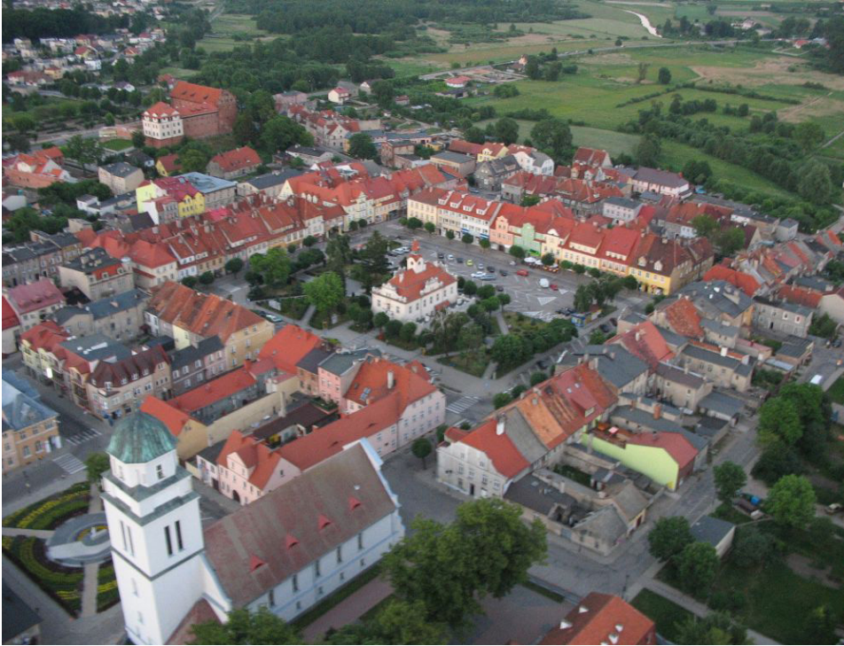
Rynek w Dziadówie z centralnie położonym ratuszem - siedzibą Interaktywnego Muzeum Państwa Krzyżackiego (fot. Adam_Nowakowski, CC BY-SA 4.0).

Instytucja ta, ulokowana w budynku historycznego ratusza miejskiego pamiętającego jeszcze czasy krzyżackie, przedstawia historię Zakonu Szpitala Najświętszej Marii Panny Domu Niemieckiego od jego początków aż do końca państwa krzyżackiego w Prusach. Multimedialność i interaktywność muzeum nie jest tylko deklaratorywna – ekspozycja wykorzystuje fotografie, ekrany dotykowe, animacje, filmy wyświetlane w hełmie projekcyjnym, rekonstrukcje ubiorów i broni, a także liczne elementy zajęć praktycznych dla dzieci. Twórcy muzeum położyli nacisk na równoległe przedstawienie dwóch wizji historii państwa krzyżackiego – negatywnej, skupionej na konflikcie z Polską, i pozytywnej, przedstawiającej zakon jako czynnik modernizacyjny w tej części Europy. Stąd też obok militariów na wystawie przedstawiane są wątki dotyczące życia codziennego czy organizacji państwa zakonnego.