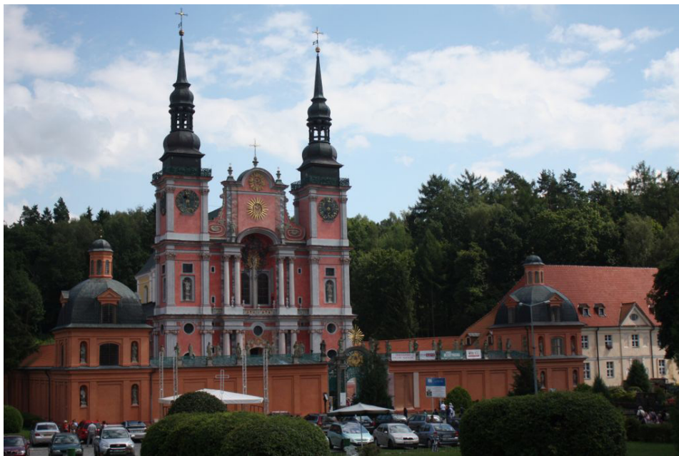
Bazylika Nawiedzenia Najświętszej Maryi Panny w Świętej Lipce.

Święta Lipka leżała po drugiej stronie granicy. To właśnie w okolicach tej wsi od końca XIV wieku rozwijał się kult rzeźby Matki Boskiej z Dzieciątkiem, którą – według legendy – stworzył nawrócony skazaniec. W miejscu tym, chętnie nawiedzanym przez pielgrzymów, wybudowano drewnianą kaplicę, która jednak w 1524 r. została zniszczona przez ewangelików. W późniejszych czasach postawiono tu... szubienicę.