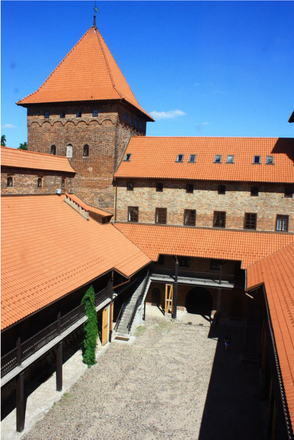
Dziedziniec zamku w Nidzicy.