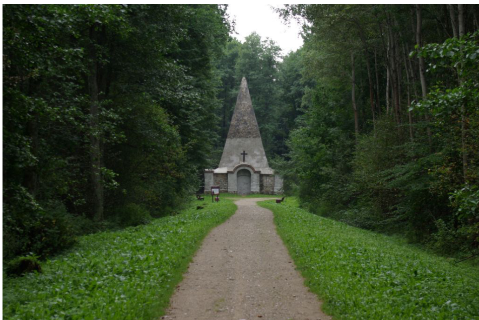
Grobowiec rodziny Fahrenheidów, tzw. piramida w Rapie.