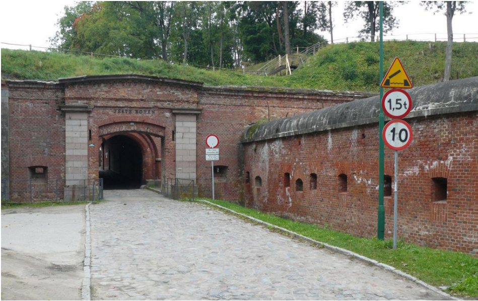
Brama wjazdowa do Twierdzy Boyen w Giżycku.

szalkowi Hermannowi von Boyenowi, dwukrotnemu ministrowi wojny Prus (w latach 1814–1819 i 1841–1847) i inicjatorowi budowy twierdzy. W skład zespołu fortyfikacyjnego wchodziły cztery bramy (główne: Giżycka i Kętrzyńska, oraz pomocnicze: Wodna i Prochowa) oraz sześć bastionów (Leopold, Ludwik, Herman, Recht, Schwert, Licht). Militarnie twierdzę przetestowano raz, w 1914 roku, w czasie ofensywy rosyjskiej na Mazurach w początkowej fazie pierwszej wojny światowej. Sama twierdza nie była wprawdzie atakowana (Rosjanom udało się tylko okrążyć Giżycką), jej załoga odegrała jednak ważną rolę w działaniach zaczepnych. Później twierdzę, uznaną za przestarzałą, użytkowano jako szpital, a w czasie drugiej wojny światowej pozostawiono do dyspozycji niemieckiego wywiadu. Zimą 1945 roku Niemcy oddali ją bez walki Armii Czerwonej. Dziś w budynkach fortecy znajduje się ekspozycja historyczna, sam obiekt zaś to dobre miejsce na ciekawy spacer.