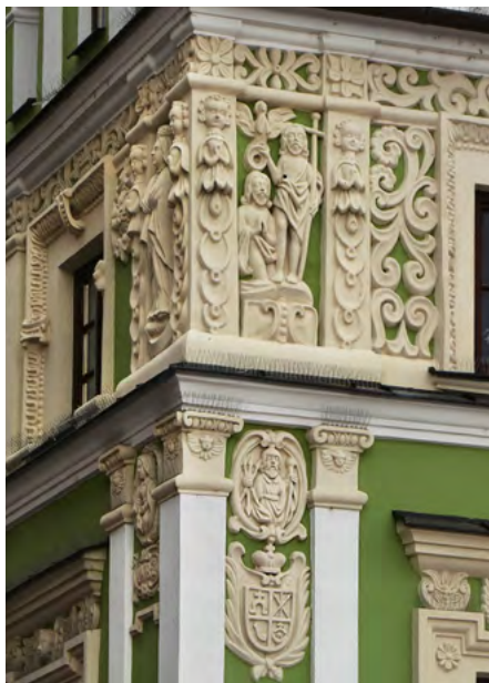
Plaskorzeźby: Jan Chrzciciel, herb Koniecpolskiego, Matka Boska