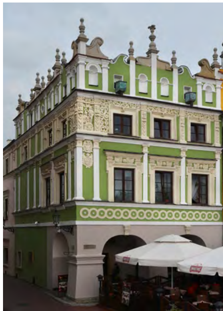
Kamienica Wilczkowska (nr 30)

Kamienica Wilczkowska (nr 30) – narożna, z dwoma fasadami – ma uwydatnioną attykę i bogatą dekorację rzeźbiarską.