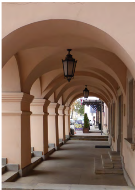
Podcień, Kołtątaja 2 (pierzeja północna)

W czterech pierwszych (30–24) mieści się Muzeum Zamojskie, a w piątej (nr 22) – liceum plastyczne.