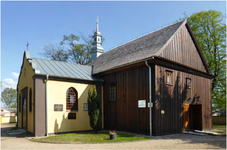
Elewacja zachodnia, od północy murowana kaplica z 1869 r.