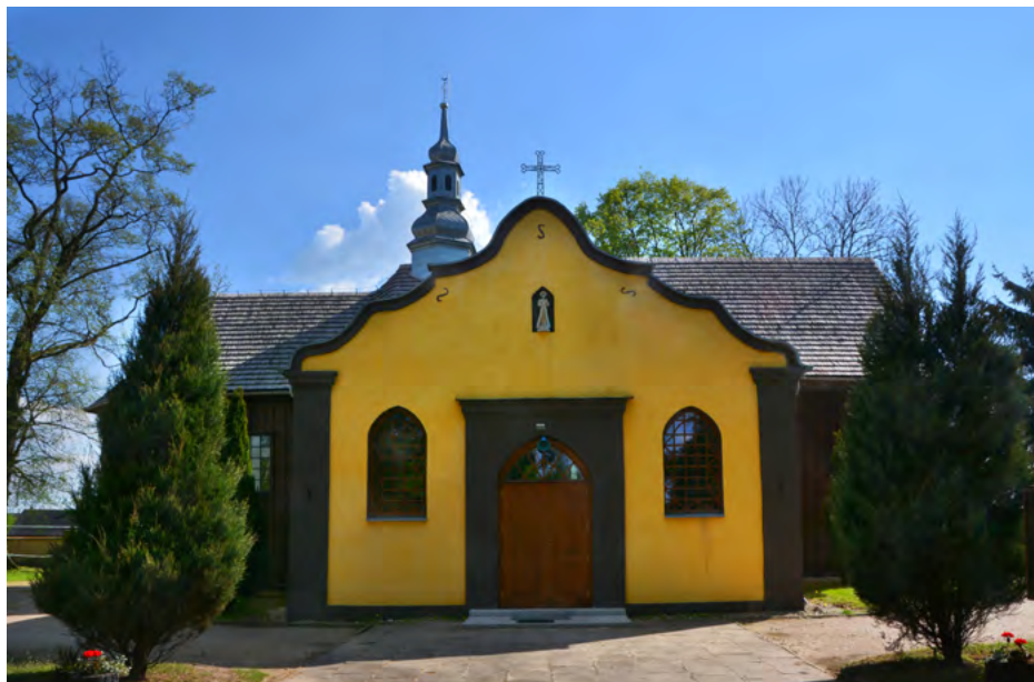
Elewacja północna, murowana kaplica z 1869 r.