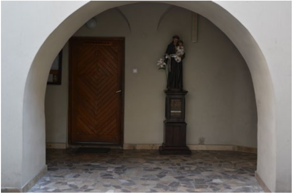
Wejście do kościoła przez krużganek

Klasztor ma nietypową budowę – aby z furty klasztornej dojść do kościoła trzeba przejść przez niewielkie krużganki.