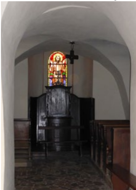
Krużganek – nawa dawnego kościoła