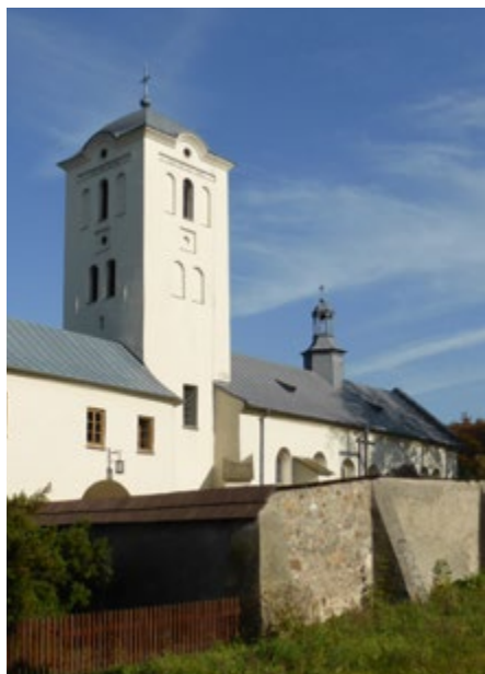
Elewacja południowa, wieża dzwonicza i sygnatorka

W 1847 r. pożar zniszczył klasztor i kościół, siedem ołtarzy, chór, organy, dzwony, bibliotekę. Bernardynki już w roku następnym przeprowadziły znaczący remont. Kolejne poważne remonty były w latach 20. i 80. XX w.