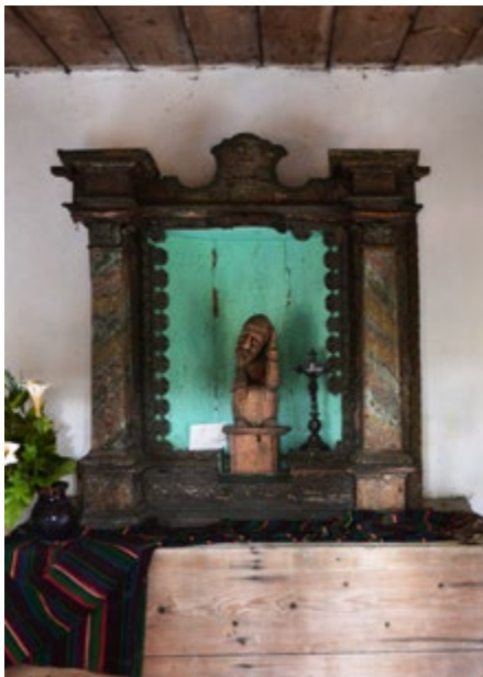
Ołtarz w kaplicy

Stefan Żeromski (1864–1925) spędził dzieciństwo w Ciekotach, u stóp Gór Świętokrzyskich.