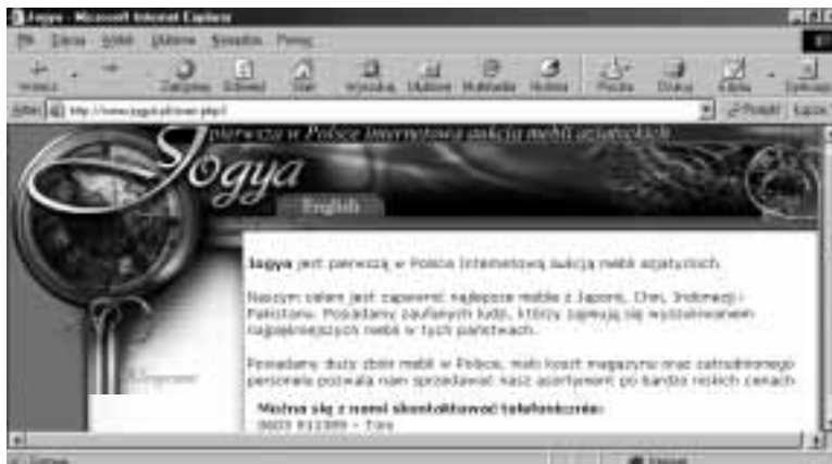
Rysunek 3.17. Dom aukcyjny Jogya

Internetowa aukcja mebli azjatyckich (rysunek 3.17). Klient może wybrać artykuł i zaproponować cenę. Jeśli w ciągu 14 dni nikt nie podbije oferty, uczestnik nabywa mebel. Towar jest dostarczany pod wskazany adres. Klient płaci tylko wtedy, gdy jest zadowolony z wybranego towaru.