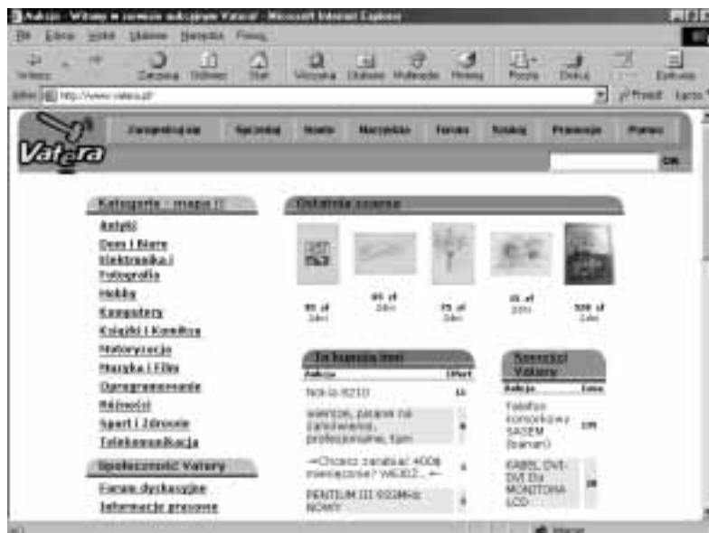
Rysunek 3.27. Dom aukcyjny Vatera

Serwis aukcyjny (rysunek 3.27). Ma ładną szatę graficzną. W dwunastu kategoriach tematycznych można znaleźć niemal siedem tysięcy ofert. Wiele wystawianych towarów nie znajduje nabywców.