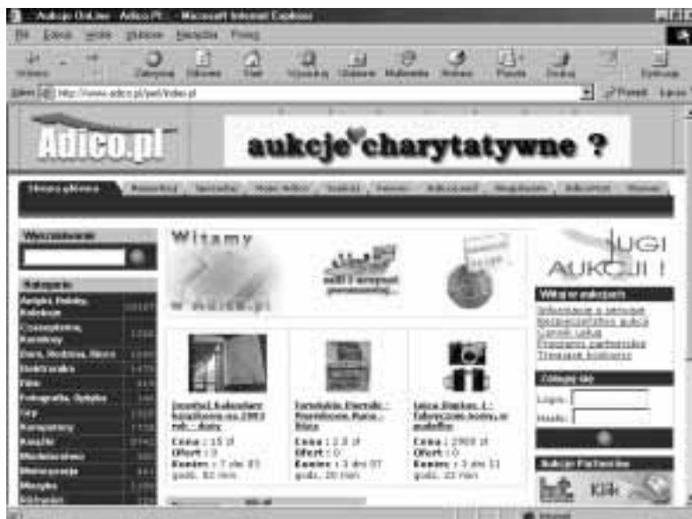
Rysunek 3.7. Dom aukcyjny Adico

Serwis aukcyjny (rysunek 3.7). Około 25 tysięcy ofert w następujących kategoriach: Antyki, Hobby, Kolekcje, Czasopisma, Komiksy, Dom, Rodzina, Biuro, Elektronika, Film, Fotografia, Optyka, Gry, Komputery, Książki, Modelarstwo, Motoryzacja, Muzyka, Różności, Sport i Zdrowie, Telekomunikacja . Użytkownicy mają do dyspozycji forum, wyszukiwarkę, system komentarzy oraz zabezpieczenie transakcji systemem Gwarant . Preferowane jest dysponowanie kontem w SKOK-u — Spółdzielczej Kasie Oszczędnościowo-Kredytowej . Aby stać się jej członkiem, należy okazać oryginalne dokumenty (a nie ich kserokopie!), jak np. dowód osobisty, zaświadczenie o zatrudnieniu itp.