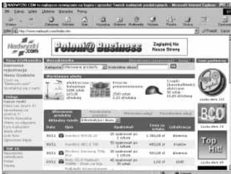
Rysunek 3.18. Dom aukcyjny Nadwyzki.com

Serwis Nadwyzki.com (rysunek 3.18) oferuje poprzez Internet szybkie i skuteczne rozwiązania problemów firmom, które oferują do sprzedaży swoje nadwyżki produkcyjne. Pomaga również tym firmom, które szukają produktów w atrakcyjnych cenach. Wszystkie usługi, jakie oferuje serwis, są darmowe.