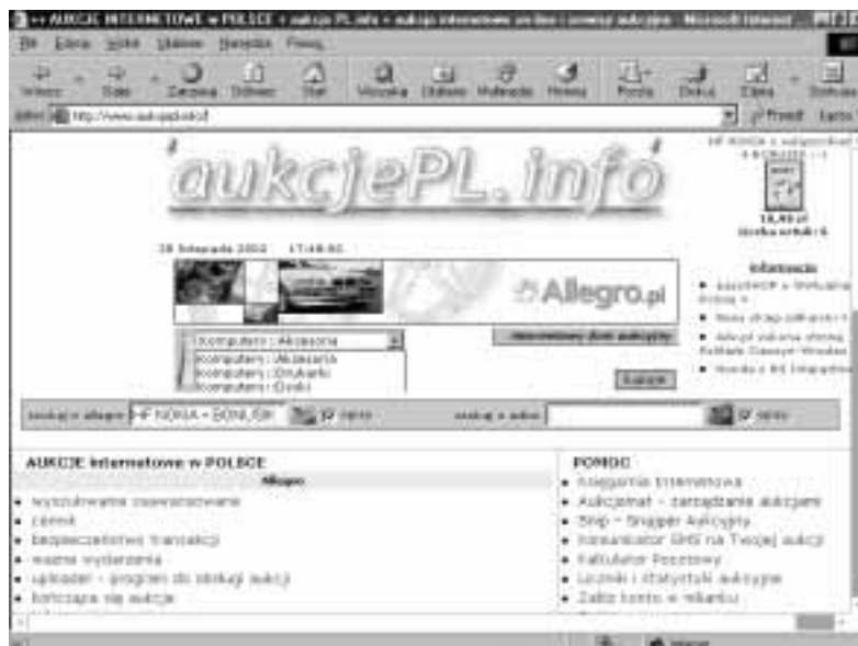
Rysunek 3.6. Niezbędny uczestnik aukcji