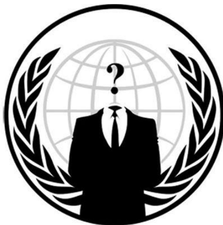
Rysunek 3-2 Logo Anonymous

Anonymous to najbardziej rozpoznawane ugrupowanie skupiające ludzi sprzeciwiających się cenzurze, korupcji czy wpływowi kościoła katolickiego. Mają wiedzę i umiejętności pozwalające im nazywać się Hackerami, jednak mają bardziej ugruntowany cel społeczno – polityczny.