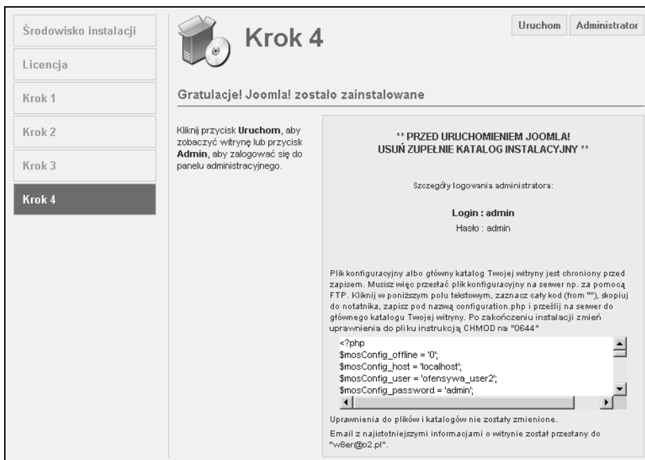
Rysunek 8.12. Podsumowanie instalacji — w zależności od rodzaju serwera, na którym instalowaliśmy skrypt Joomla!, okno końcowe może wyglądać inaczej

W prawym górnym rogu widoczne są również dwa przyciski: odnośnik do strony głównej naszego nowego serwisu ( Uruchom ) oraz do panelu administracyjnego ( Administrator ) (patrz rysunek 8.12).