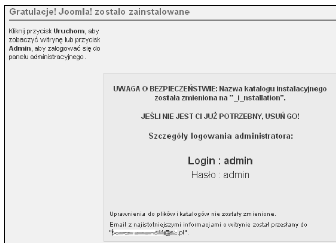
Rysunek 8.11. Instalator Joomla! — podsumowanie instalacji

W prawym górnym rogu widoczne są również dwa przyciski: odnośnik do strony głównej naszego nowego serwisu ( Uruchom ) oraz do panelu administracyjnego ( Administrator ) (patrz rysunek 8.12).