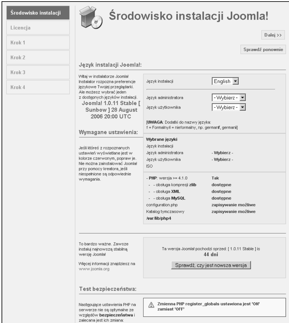
Rysunek 8.5. Instalator internetowy — test przedinstalacyjny

nek 8.5), druga mówi o ustawieniach PHP, natomiast trzecia informuje o prawach dostępu do plików (patrz rysunek 8.6).