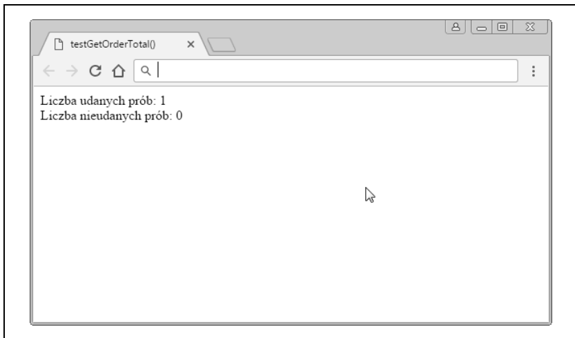
Rysunek 1.1. Pomyślne wyniki testu jednostkowego

W wyniku wykonania funkcji testGetOrderTotal test spełnił asercję, tak jak widać na rysunku 1.1.