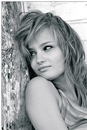
Rysunek 4.8. Przykłady fotografii w stylu glamour