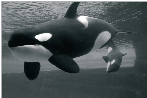
Rysunek 4.16. Przykład fotografii orki wykonanej w akwarium