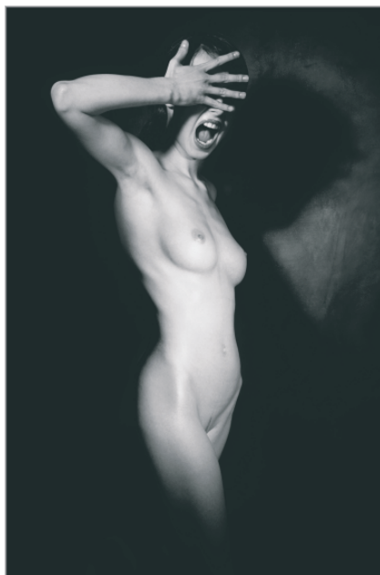
Rysunek 4.9. Przykład aktu

Przed przystąpieniem do zdjęć pamiętaj, aby modelowi udostępnić możliwość rozebrania się w pomieszczeniu odseparowanym od miejsca, w którym będą wykonywane zdjęcia. Jednym słowem chodzi o zapewnienie mu intymności. Ponadto należy pamiętać o wybraniu takiego pomieszczenia, w którym wytworzy się atmosfera intymności — powinno być zamknięte, tak by nikt poza fotografem i modelem nie miał do niego dostępu. W pomieszczeniu powinna panować odpowiednia temperatura — niezbyt wysoka (nie zależy nam przecież, by udusić naszego modela ani żeby pot spływał po jego ciele) i nie za niska (niedopuszczalne jest, aby model zgrzytał zębami z zimna, nie chcemy również widzieć na jego ciele gęsiej skórki).