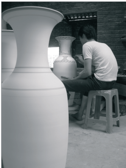
Rysunek 4.5. Przykład portretu środowiskowego

się pracą i w miarę możliwości nie zwracała na Ciebie uwagi. Dyskretnie ją obserwuj. Wędrując po otoczeniu, w którym znajduje się model, szukaj odpowiedniego punktu widzenia. Od czasu do czasu poproś modela, by spojrzał w Twoją stronę. Kiedy nadejdzie odpowiedni moment, wykonasz zdjęcie. Fotografia cyfrowa ma tę zaletę, że od razu możesz pokazać modelowi efekt swojej pracy. To sprawia, że ludzie chętniej dają się fotografować.