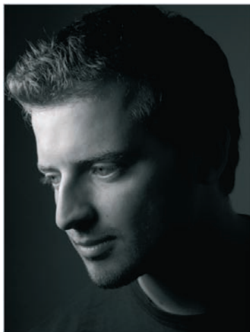
Rysunek 4.1. Przykłady portretu