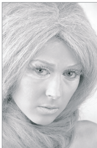
Rysunek 4.7. Portrety kreacyjne

zdjęciach odgrywają: makijaż, rekwizyty, uczesanie oraz ubranie (a właściwie kostium). Za pomocą tych elementów można diametralnie zmieniać charakter zdjęcia. Wszystko zależy od inspiracji i wyobraźni fotografa oraz talentu modela. Niebagatelną rolę odgrywa tu dobry kontakt pomiędzy fotografującym a fotografowanym.