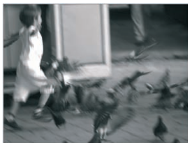
Rysunek 4.11. Fotografie, na których utrwalono ruch dzieci.

Na zdjęciu po lewej ruch został zamrożony, na zdjęciu po prawej — przeciwnie