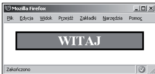
Rysunek 7.1. Witryna stosująca style

Rysunek 7.1 przedstawia wygląd opisanej witryny. Trzy podane przykłady: pierwszy ze stylami zewnętrznymi, drugi stosujący style wewnętrzne i trzeci wykorzystujący atrybut style , mają identyczny wygląd.