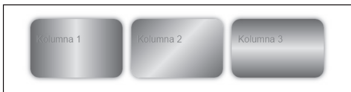
Rysunek 2.2. Gradienty liniowe w tle elementów dodane przy użyciu wstawki Lessa

Finalną postać elementów stopki przedstawia rysunek 2.2.