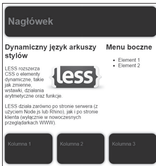
Rysunek 2.1. Układ strony określony w kodzie Lessa

Spróbujmy teraz otworzyć w przeglądarce stronę http://localhost/rozdzial_02/index.html . Zostanie wyświetlona strona o bardzo prostym układzie, zawierająca nagłówek, blok treści, menu boczne oraz stopkę składającą się z trzech kolumn. Postać tej strony przedstawia rysunek 2.1. Wszystkie elementy menu mają niebieskie akcenty. Teraz otworzymy w ulubionym edytorze pliki less/variables.less .