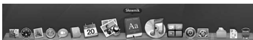
Rysunek 5.8. Powiększanie elementów Docka

Dock pozwala na ustawienie powiększania ikon w momencie umieszczenia nad nimi wskaźnika myszy. Efekt działania tej funkcji został pokazany na rysunku 5.8. Aby móc skorzystać z tej możliwości, należy wybrać odpowiednie ustawienie, używając menu Jabłko .