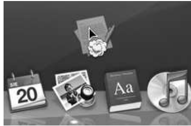
Rysunek 5.7. Usuwanie skrótów programu z Docka