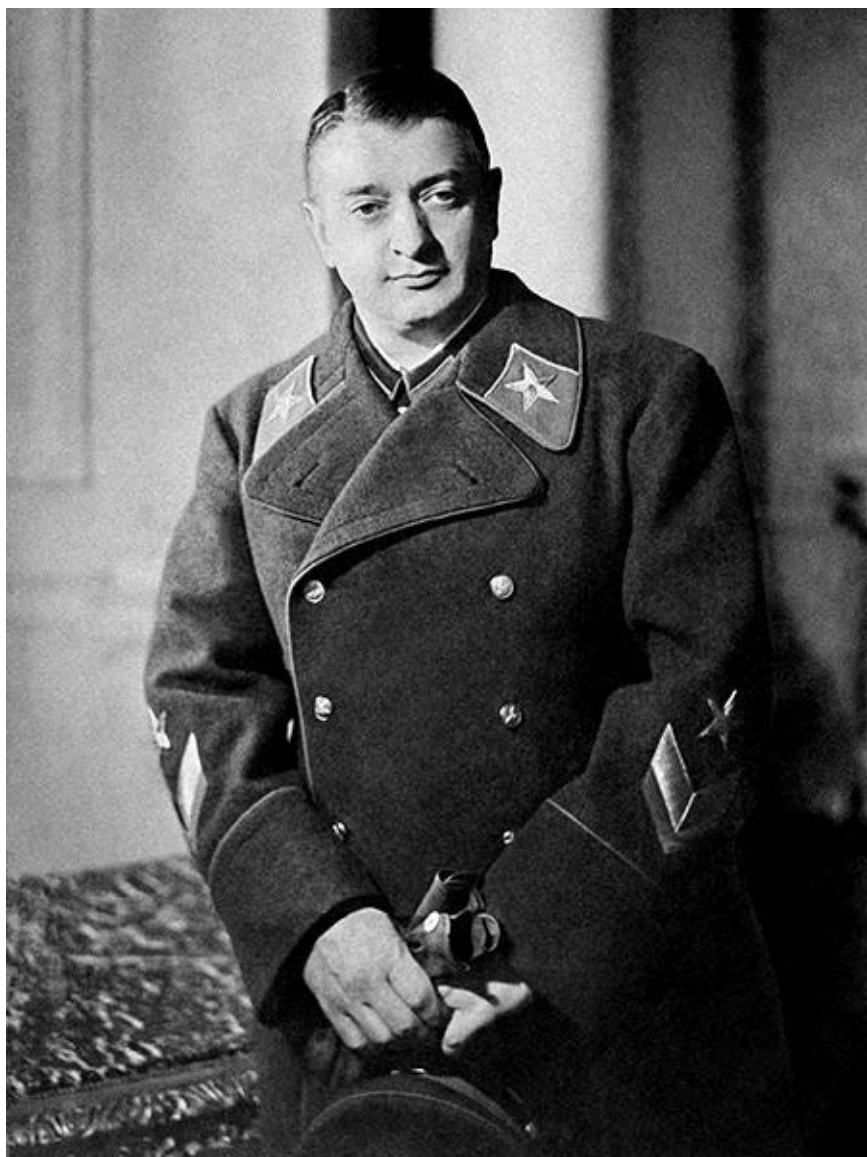
Marszałek Michaił Tuchaczewski na zdjęciu z 1936 r.