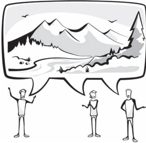
RYSUNEK 3.1. Wspólna wizja

W yobraź sobie okno z przyciskiem Zamknij . Jak wygląda Twoje wyobrażenie? Jaki kolor ma okno? Po której stronie umieszczony jest przycisk? Czy przycisk ma obrazek, czy nie? Czy napis Zamknij ma aktywny znak? Z pewnością Twoje wyobrażenie jest różne od wyobrażeń innych czytelników i czytel- ników. To naturalne, że każdy z nas ma indywidualne preferencje i wyobrażenia. Każdy z nas jest inny. Poszczególne elementy naszej