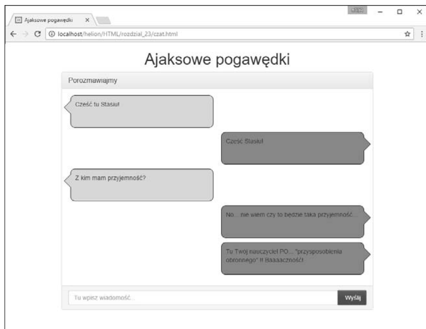
Rysunek 23.2. Ajaksowe pogawędki w akcji

Aby ożywić statyczny dokument HTML wczytany i wyświetlony w przeglądarce, musimy zaimplementować w języku JavaScript kod, który nawiąże połączenie z serwerem PHP na serwerze i wyświetli przesłane przez niego wiadomości. Wszystkie te operacje są wykonywane przez skrypt JavaScript o nazwie klient.js , do którego odwołuje się przedstawiony wcześniej dokument HTML.