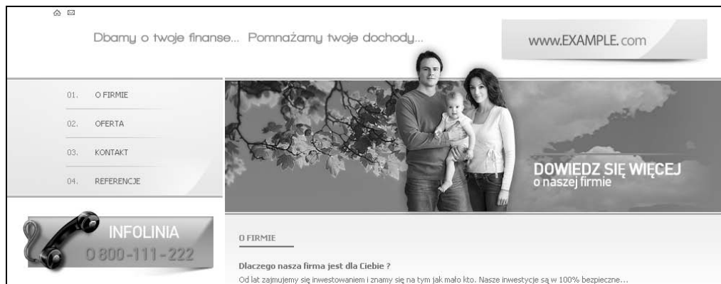
Rysunek 4.1. Widok instalacji szablonu finanse_widok

Jeżeli wszystkie polecenia wykonałeś poprawnie, na ekranie zobaczysz zawartość przedstawioną na rysunku 4.1.