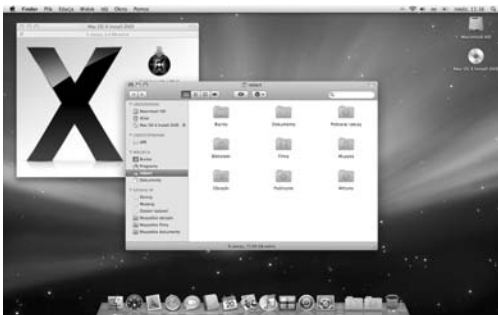
Rysunek 1.7. Po zakończeniu instalacji na ekranie zostanie wyświetlone biurko systemu operacyjnego Mac OS X 10.5 oraz okno katalogu domowego użytkownika