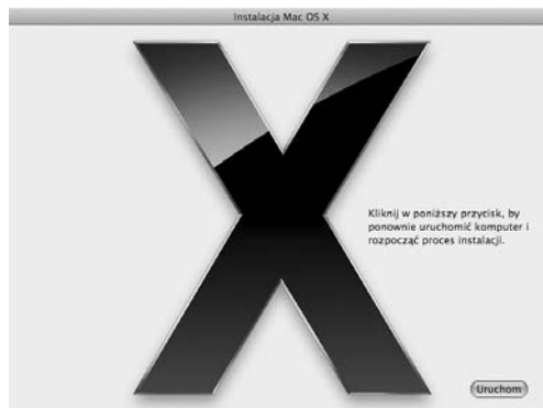
Rysunek 1.4. Program instalacyjny prosi o ponowne uruchomienie komputera