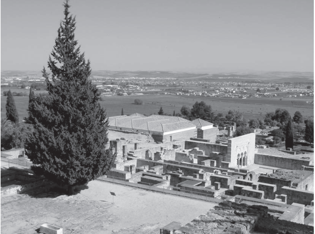
Rysunek 6.7. Teren wykopalisk archeologicznych (Madinat az-Zahra); częściowa rekonstrukcja zburzonego zamku. Dokonane na terenie wykopalisk znaleziska archeologiczne wymagają odpowiedniego zabezpieczenia, co często opóźnia prace projektowe oraz budowlane, ale daje możliwość pokazania tradycji miejsca

towych (przykładowo w trakcie prac odkrywkowych okazuje się, że na terenie projektowanym znaleziono artefakty archeologiczne; rysunek 6.7), nowych zasad finansowania całej inwestycji bądź też innych, trudnych do przewidzenia przyczyn.