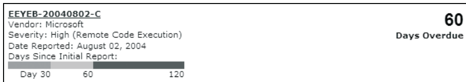
Rysunek 1.2. Metoda stosowana przez firmę eEye przy „wstępnym” publikowaniu błędów

zajmuje zwykle znacznie dłużej niż wspomniane 60 dni. Wygląda na to, że do tej pory poprawki takich błędów powstawały nawet w ciągu kilku dni, ale tylko w sytuacji, gdy w internecie szalał robak wykorzystujący określony błąd.