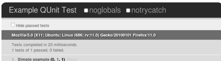
Rysunek 5.1. Rezultat wykonania prostego testu w QUnit

jest asercja ok(value) . Jeśli wartość value jest prawdziwa, wówczas test zakończony zostaje sukcesem. Po umieszczeniu powyższego kodu w pliku tests.js i uruchomieniu w przeglądarce strony z listingu 5.1 zobaczymy wynik uruchomienia testów pokazany na rysunku 5.1.