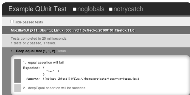
Rysunek 5.4. W przypadku porównywania złożonych obiektów posłuż się asercją deepEqual()

Wyniki testu pokazane są na rysunku 5.4.