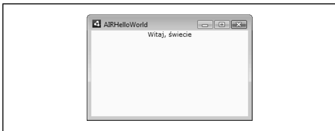
Rysunek 2.2. Aplikacja AIRHelloWorld uruchomiona za pomocą programu ADL w systemie Windows Vista

Aplikacja powinna uruchomić się w standardowym oknie systemu operacyjnego (rysunek 2.2).