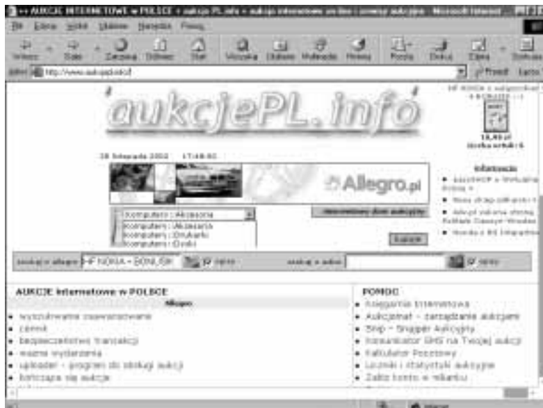
Rysunek 3.6. Niezbędny uczestnik aukcji