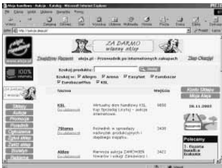
Rysunek 3.5. Wyszukiwarka produktów podpowiada, który dom aukcyjny wybrać

Na stronie głównej katalogu aukcji Aleja Handlowa znajduje się okienko wyszukiwarki. Po wpisaniu słowa kluczowego przeszukiwanych jest sześć serwisów aukcyjnych: Allegro , Arena , EasyNet , Eurobazar , EurobazarPlus oraz KSL . Wyniki wyszukiwania zawsze pokazują aktualną zawartość serwisów aukcyjnych. Daje to możliwość znacznej oszczędności czasu (rysunek 3.5).