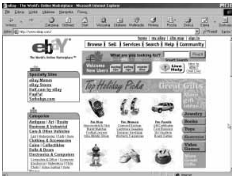
Rysunek 3.2. Pionier i lider aukcji internetowych

W eBay handluje się nie tylko drobiazgami. W serwisie można znaleźć informację ( http://cgi.ebay.com/ws/eBayISAPI.dll?ViewItem&item=1788349972 ), że za sumę dwunastu milionów dolarów został sprzedany 60-letni dom, w którym spędził dzieciństwo znany amerykański raper Eminem. Fani Eminema złożyli 253 oferty kupna.