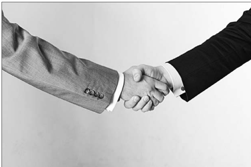
Zdjęcie 1.1. Dłoń właściwie podana do powitania