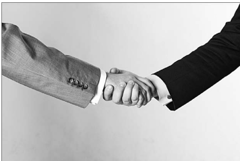
Zdjęcie 1.2. Dłoń niewłaściwie podana. Dłoń podana z góry sugeruje, iż chcemy górować, nie jest to zbyt eleganckie