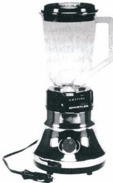
Samochodowy mikser wyprodukowany przez Whistler Corporation

Zastanów się na przykład nad zapalniczką w Twoim samochodzie. Początkowo to urządzenie miało tylko jedną funkcję — dawało Ci możliwość powolnego zabijania siebie i pasażerów w czasie jazdy. Projektanci samochodów nie przewidywali powszechnego zapotrzebowania na energię do telefonów komórkowych i antyradarów. Po pewnym czasie firma o nazwie Whistler Corporation skonstruowała wentylatory, megafony, ekspresy do kawy, miksery i suszarki do włosów, które pobierają prąd z gniazda zapalniczki. Ostatnio producenci zaczęli montować w samochodach kilka wtyków zasilających, które nie służą już wyłącznie do podłączenia zapalniczki, ale są źródłem prądu dla wszelkich urządzeń, których przeciętna rodzina używa w samochodzie.