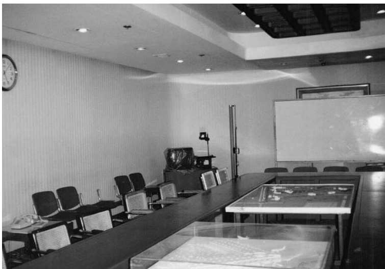
Fotografia przedstawiająca salę posiedzeń zarządu; pod sufitem unosi się dziwna mgielka

„Była mniej więcej ósma wieczorem. Jadłam właśnie w sali zarządu, gdy usłyszałam pukanie do drzwi. Byłam wtedy z dwiema innymi sprzątaczkami. Wszystkie słyszeliśmy to pukanie. Powiedziałam głośno: »Proszę wejść!«. Gdy otworzyłam drzwi, na zewnątrz nie było nikogo. Wróciłam do stołu, by dokończyć posiłek. Nagle łyżka wypadła mi z ręki, talerz zaczął się kręcić wokół własnej osi, a potem spadł ze stołu”.