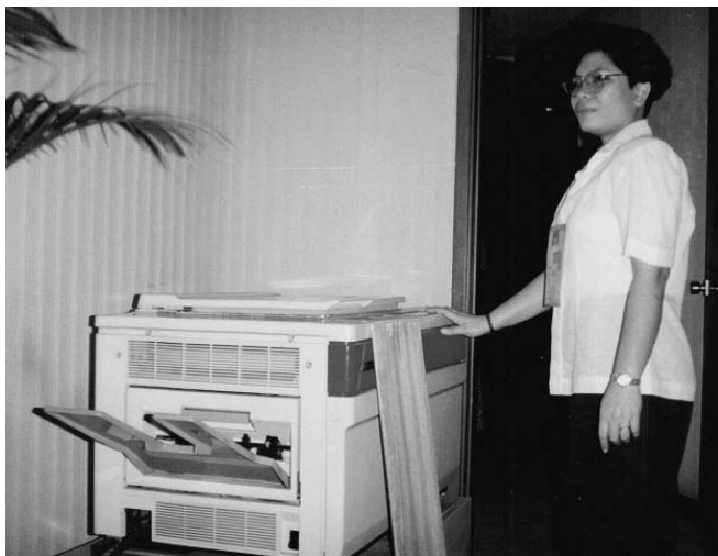
To ksero w tajemniczych okolicznościach uruchamiał się samo

„Zdenerwowałam się i głośno krzyknęłam: »Kimkolwiek jesteś, niezależnie od tego, czego chcesz, proszę, pokaż się i powiedz, o co ci chodzi. Nie boję się ciebie«. Wszyscy obecni w pokoju czekali na jakąś odpowiedź, ale nic dziwnego już się nie zdarzyło. Dołączyliśmy więc kolację”.