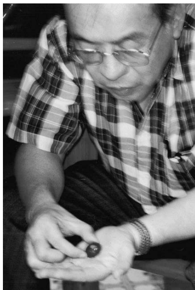
Autor ogląda czarny kamień, używany podczas seansu bolo-bolo

„Uzdrowiciel powtórzył symboliczny akt oczyszczenia, ale woda znów stała się brudna. Podczas trzeciej próby w szklance nagle pojawiła się mała kość naznaczona krzyżykami. Kiedy w trakcie kolejnej sesji woda w szklance znów zmętniała, bolo-bolo dmuchnął na nią, a ta, jakby w wyniku działania jakiejś magicznej siły, natychmiast się oczyściła. Był to znak świadczący o tym, że infekcję ostatecznie usunięto”.