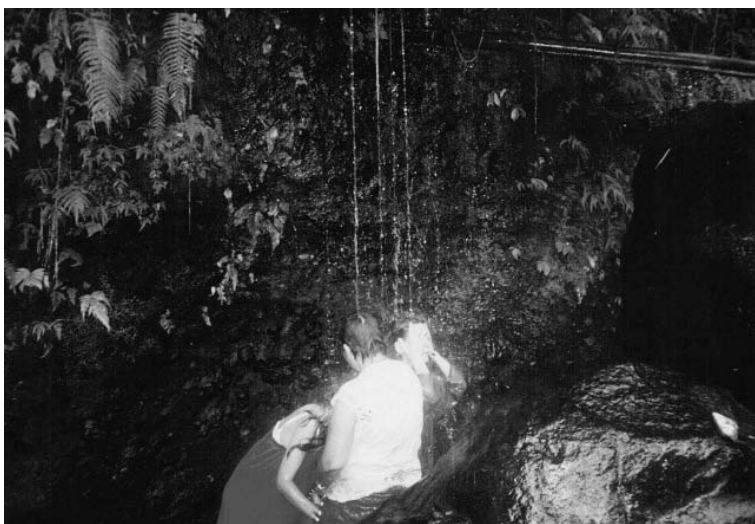
Autor najpierw usłyszał Święty Głos pod męskim wodospadem Santa Lucía, a potem usłyszał go również blisko żeńskiego wodospadu, położonego nieopodal

Pewnego razu towarzyszyłem grupie ludzi w zwiedzaniu góry. Przy wodospadach Santa Lucía musiałem zaprezentować im rytuał obmywania się, polegający na trzykrotnym wypiciu wody i na modlitwie. Miałem zamiar szybko wyjść spod wodospadu, ponieważ myślałem, że jak zwykle woda będzie bardzo zimna, lecz kiedy znalazłem się pod pierwszym z wodospadów, zauważyłem, że jest przyjemnie ciepła. Nie mogłem w to uwierzyć, pomyślałem, że to chyba tylko moja wyobraźnia. Zamierzałem już wyjść, kiedy nagle usłyszałem donośny, męski głos: „ Huwak kang magma dali. Kami ang sumusubaybay sa iyo ”. (Nie spiesz się tak. Obserwujemy cię).