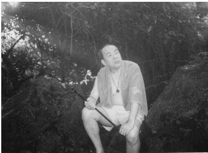
Autor siedzący spokojnie przed Źródłem Świętego Jakuba trzyma w ręku drewniany patyk