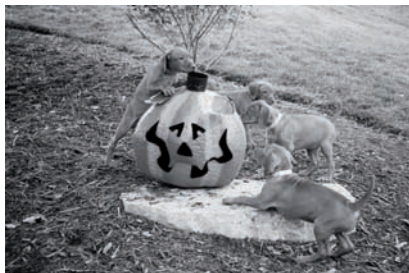
Miot szceniąt rasy wyżeł węgierski krótkowłosey bada swoje otoczenie

zanim postawiła go na ziemi. Uda- wało jej się to przez kilka miesięcy, do czasu gdy właściciel budynku musiał wejść do jej mieszkania, by dokonać drobnej naprawy. Ups! Właściciel dał jej wybór: wyniesie się ona, pies albo oboje. W tym czasie kobieta była już bardzo przywiązana do psa, ale nie mogła znaleźć podobnego mieszkania z takim czynszem, na który byłoby ją stać. Podstawowa zasada brzmi: przeczytaj umowę .