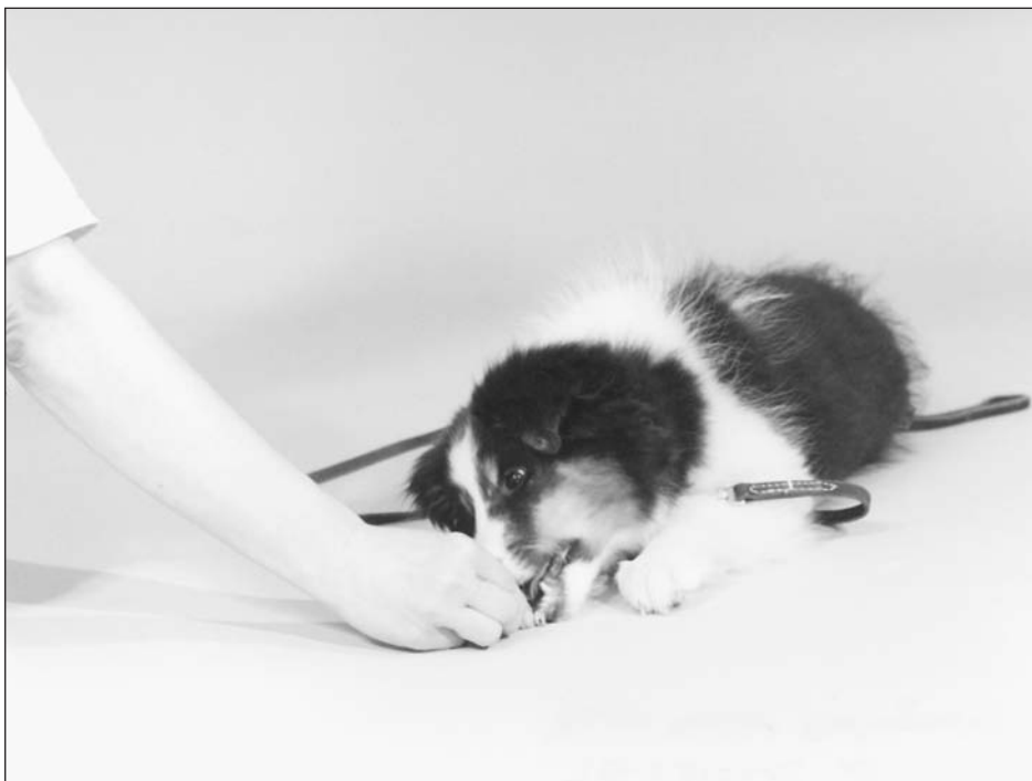
Rysunek 5.2. Szczęnię owczarka szetlandzkiego naprowadzane do pozycji „waruj”

Niektóre psy mają problemy z opanowaniem komendy „waruj” i zatrzymują się na siadzie. A oto kilka wskazówek, które mogą okazać się pomocne przy nauce warowania: