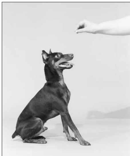
Rysunek 5.1. Pinczer miniaturowy naprowadzany do pozycji „siad”

Przejdźcie od komendy „siad” do komendy „siad zostań” przebiega dwuetapowo. Najpierw pies musi wytrwać w jednej pozycji przez określony czas (czas trwania), a następnie utrzymać ją, gdy trener się oddala (odległość). Jeśli nauczymy psa takiego zachowania, rozkładając naukę na dwa etapy, będzie on w stanie poprawnie wykonać komendę „siad zostań” w warunkach działania różnych bodźców rozpraszających uwagę. Utrzymania pozycji przez określony czas uczy się w następujący sposób: