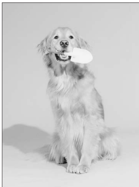
Rysunek 5.3. Golden retriever z łopatką do piasku w zębach

Ten aspekt również wiąże się z czasem, a ściślej rzecz biorąc, z okresem, przez jaki pies musi wytrwać w danej pozycji do momentu podania mu nagrody, na przykład z uniesioną łapą przy wykonywaniu polecenia „pomachaj łapą”. Można nauczyć psa utrzymywania pozycji przez opóźnianie momentu kliknięcia i nagrodzenie go dopiero wtedy, gdy udało mu się utrzymać pozycję dłużej. Jeśli starasz się przedłużyć czas, jaki pies ma wytrwać w danej pozycji, musisz to robić powoli, aby nie doszło do całkowitego regresu. Jeśli narzucisz zbyt duże tempo, a pies przestanie wykonywać polecenia, musisz zacząć